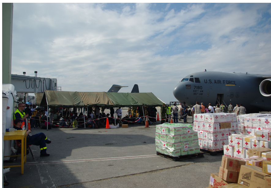
Haiti elanikud ootamas riigist lahkumist Port au Prince lennujaamas

Eesti on toetanud Haitit nii rahaliselt kui saatnud eksperte kriisipiirkonda