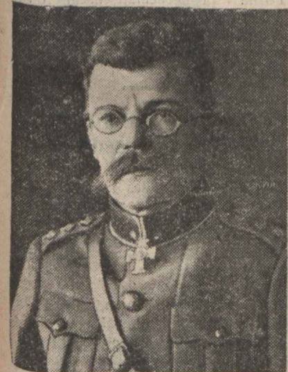
Kindral Põder, Vabadussõja kangelane.