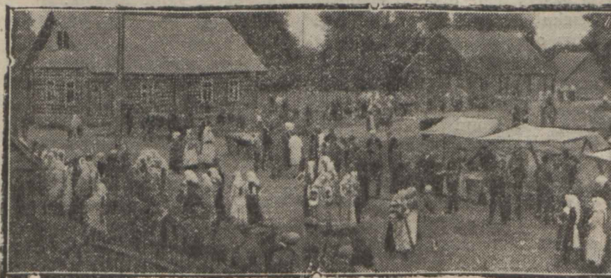
„Guljänie“ Värskas. Setunaised rahvariideis.

Vallamaja ees on suur aed, olen sekretäri poeg, ja me oleme tihti oma vennaga säälmäng. Säälsamas me mängimegi sõjaväe meest. Laevad lähevad säälmängu.