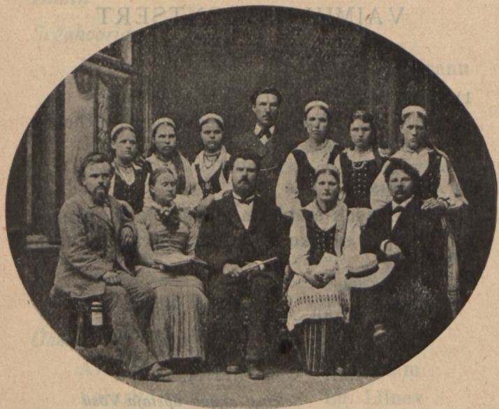
Kanepi segakoor 1884. a.

Palju variseb mehi ja naise Manalasse. Palju tuuli puhub üle kodumaa pinna. Ükski aga ei kustuta Eesti laulu, mis on kõlama pan- dud juba kaugete aegade eest.