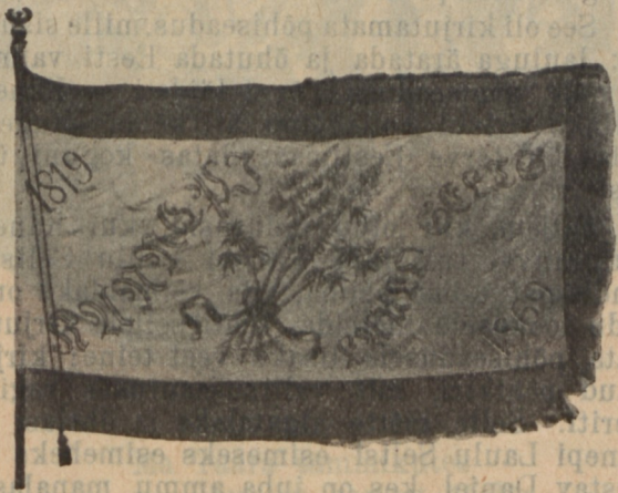
Kanepi Laulu Seltsi lipp.

1869. a. löödi esimene lahing — vaimu- lahing — meie iseseisvuse võitluses. Relva-