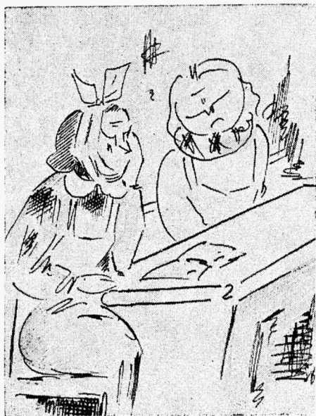
On moodi läinud päade, kaelte, käte jt. ihuliikmete kinnimässimine.

muud sellesarnast haigust, sest on kuulda, et sarlakite pärast on koolle suletud, kuid kuna kõikide kiusete sarlakid pole kooli kollitama tulnud, käib koolitöö endiselt.