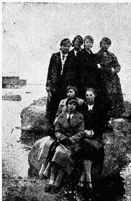
Vb g. kl. õpilasi Tallinnas merekaldal sügisese ekskursiooni puhul.

Üleni higised ja tolmuga kaetud, mis halli puudrina kattis meie nägusid ja käsivarsi, vallutasime hä-