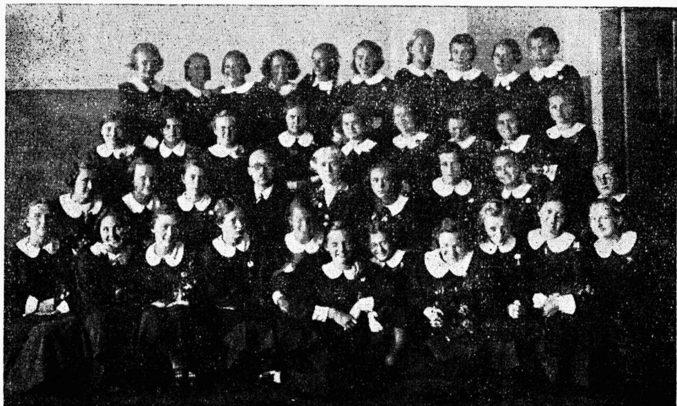
Reaalkooli IIIa klassi õpilased ühes direktori ja klassijuhatajaga kooli lõpumärkide saamise puhul.