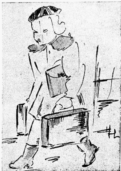
Kõik lisaesemed soovitatakse kaasas kanda vastavate kohvritega.

Üldse on koolis levinenud haigusi. 99,9% õpilastest (kes üldse on klassi ilmunud) kannatavad tundide ajal koledasti häälepuuduse, päävalude ja muude sellesarnaste haiguste käes. Igaüks ennustab teisele vähemalt sarlakeid või