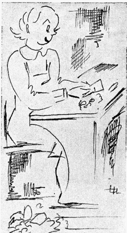
Tüdrukuid olevat vallutanud maania paberilipakaid peeneks rebida.

On kerkinud ka üles küsimus, et tüdrukud ei kannaks pääle raamatute ühtegi kõrvalist eset portfellis. Võimlemisriided, võimlemisingad, võileivad, käsitöö ja muud sellesarnased esemed soovitatakse kaasas kanda vastavate kohvritega. Asi on iseenesest hää, aga küsitavaks jääb, kas mõni väiksem