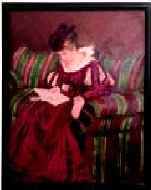
R. von zur Mühlen. Daami portree. Õli, papp. EKM