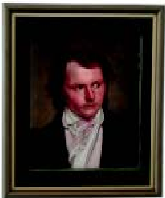
L. Maydell. Autoportree. Õli, lõuend. EKM