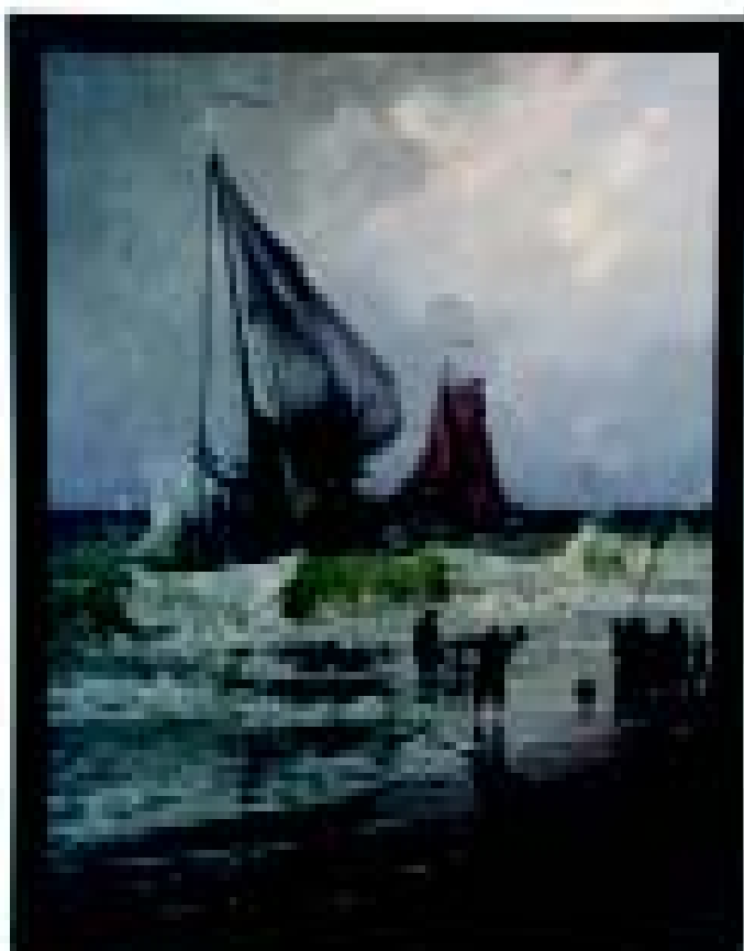
R. Moeller. Bretagne'i kalurid. Õli, lõuend. EKM