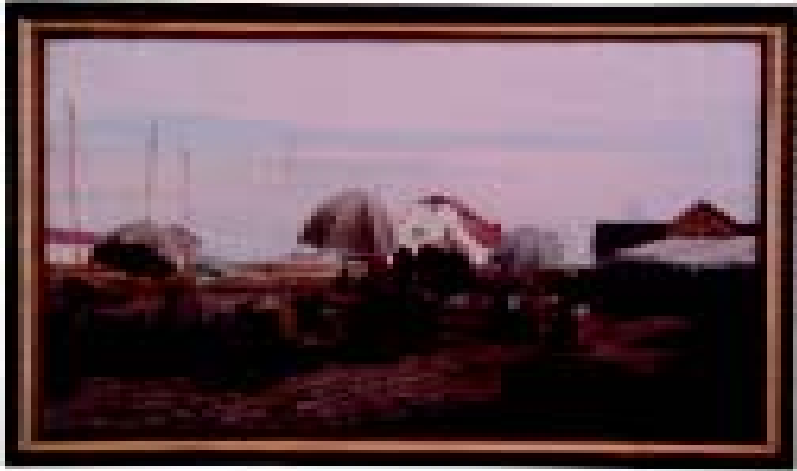
O. Hoffmann. Tartu turg. Õli, lõuend. EKM