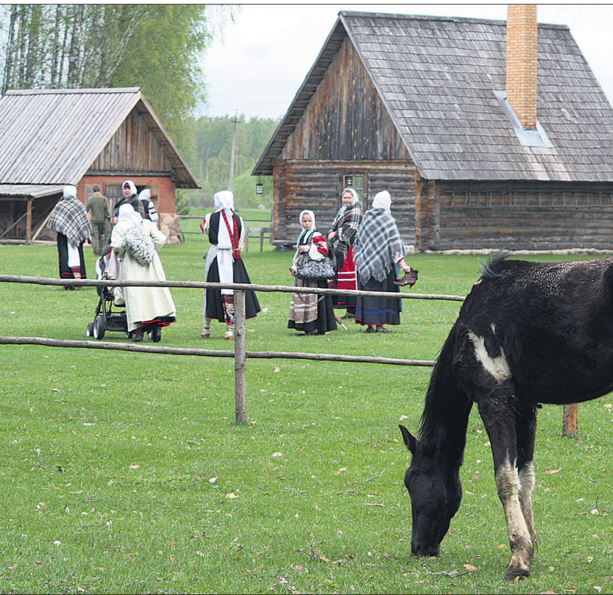
Linnainimene imestab, kas nad ongi iga päev nii riides.