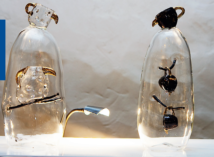
Maie Mikof-Liivik demonstreerib sarjas "Vaikelu 1,2" (2012) leekpöleti tehnikaga saavutatud meisterlikkust.