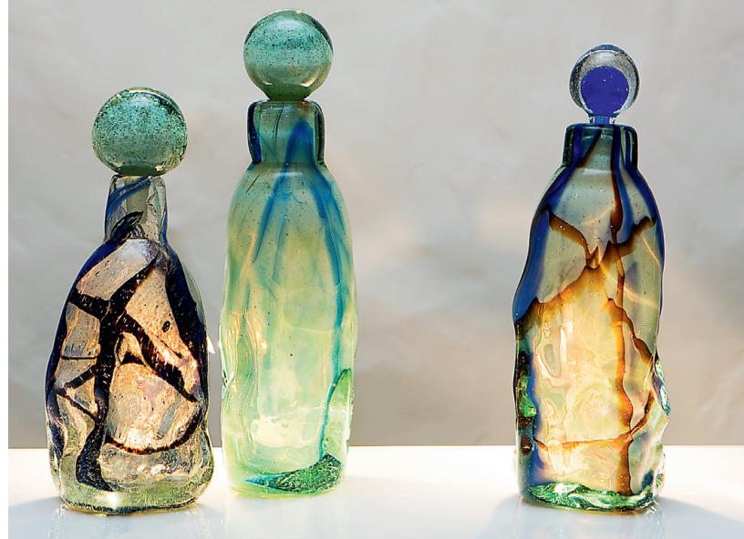
Peeter Rudaši "Reljeefsed pudelid" (2008) on Saaremaalt pärit puhumisdisaini ehe näide.

Riho Hüti "Kultuuriruumi" (2010) iseloomustab graveeringu ja LED-valguse efektne kasutus. Autori tööd on puhta ja pisut minimalistliku joonega.