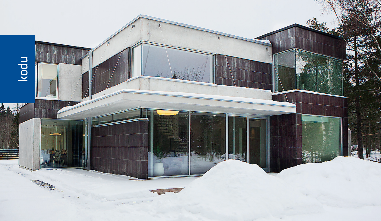
Hoone fassaadis domineerivad klaas, betoon ja keraamilised plaadid.