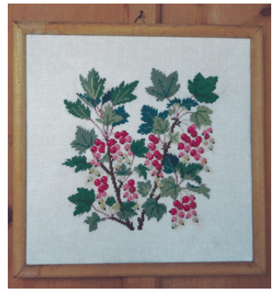
Kaunilt tikitud ristpistesõstrad on raamitud ning kaunistavad kodu.

Kes mustri valimist ja lõngade arvutamist tüütuks peab, võib poest osta valmis komplekti, kus muster on juba kangale kantud ning ka vajalikud lõngad tegija eest valitud.