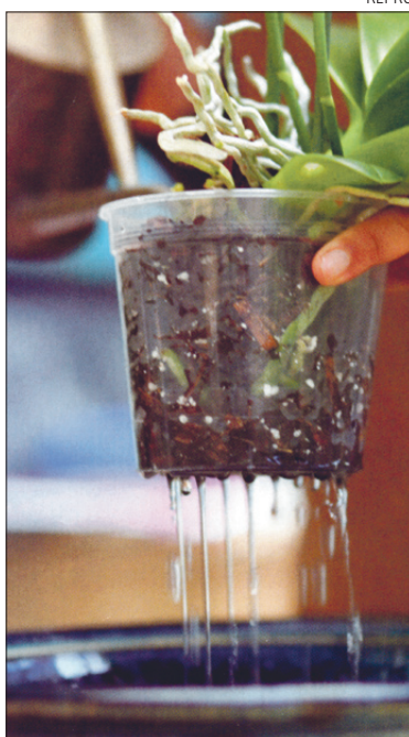
Laske kastmisveel viimse tilgani potist välja nõrguda.

Läbikastetud pott on raske. Järgmine kord kastke alles siis, kui pott on muutunud taas kergeks. Kui-gi segu kuivab pealt kiiresti, jagub poti sees niiskust tunduvalt kauemaks. Kastmise tihedus sõltub sel-