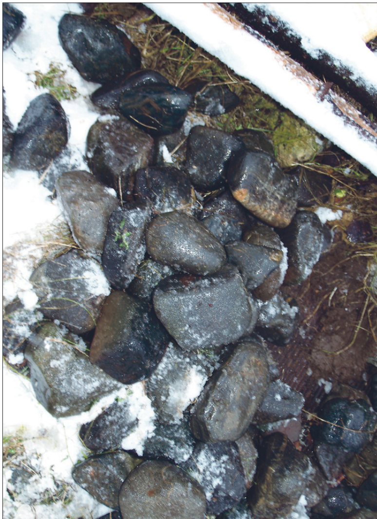
Sellised tumehallid kivid sobivad hästi kerisekivideks.