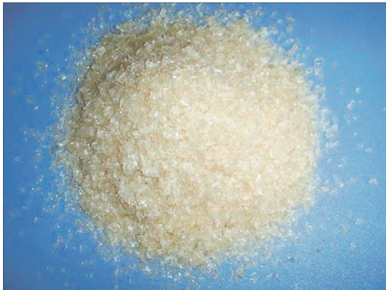
Želatiini kaubastatakse näiteks pulbri kujul.

Struktuurimoodustajana kohtame želatiini tarrendvorstides. Nende valmistamiseks valatakse kuum želatiinilahus lihatükikidega täide-