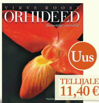
Orhideed – taimeriiigi juveelid VIRVE ROOST 136 lk, kk

Eesti orhideekasvatuse grand old lady kirjutatud mitmekülgsest raamatust leiab rohkesti infot nende kuninglike lillete ajaloost, populaarteaduslikku botaanikat ning terve hulga ilusaid fotosid. Asjalikud kasvatuse nõuanded on kodusele orhideekasvatajale selgelt lahti seletatud, seega on raamat algajale hea esimene abimees, kuid ka kogenum kasvataja leiab siit palju huvitavat.