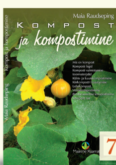
Kompost ja kompostimine MAIA RAUDSEPIG 77 lk, pk

Metsamarjadest rääkides tulevad silme ette maasikad, mustikad, pohlad ja ehk murakad. Tegelikult on metsamarju hoopis rohkem: osa neist väga maitsvad, teised lihtsalt söödavad, samas mõned küll ahvatleva välimusega, kuid ohtlikult mürgised. Raamat tutvustab pildi ja sõna abil 38 tuntumat Eesti metsamarjataime ja n-ö põhilike kõrval juhitakse tähelepanu ka nendega sarnaste perekonda kuuluvatele või lihtsalt sarnastele liikidele. Seega on kokku juttu ligi poolesajast taimest.