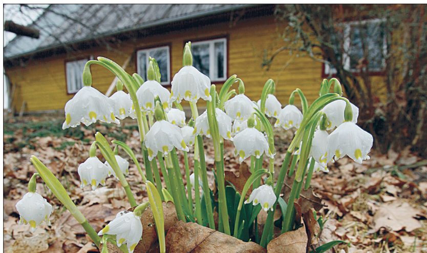
Esimesed lilled kuulutavad ka kevadtööde algust.

■ Avage alt tuulutatavate põrandate tuulutusaugud ja paigaldage võrgud, et kaitsta maja näriliste eest.