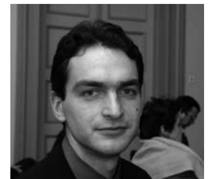
Kalmar Kurs Haridus- ja Teadusministeeriumi avalike ja välissuhete osakonna juhataja

Trükis ilmub Euroopa Komisjoni toetusel, aga Komisjon ei vastuta selle sisu kasutamise tulenevate tagajärgede eest.