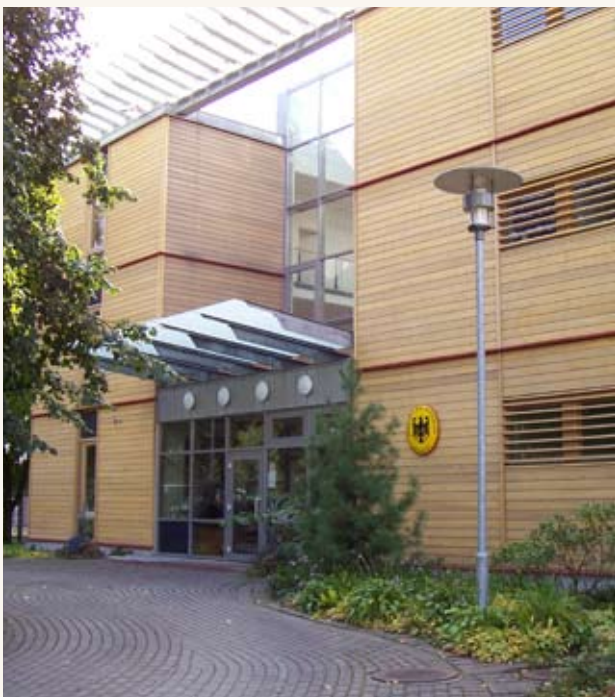
Saksamaa LV Suursaatkonna hoone kaasajal aadressil Toom-Kuninga 11.

Das heutige Botschaftsgebäude in der Toom-Kuninga-Straße 11.