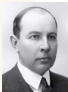
RUDOLF MÖLLERSON 1939–1940

Ab dem 1. August 1936 wurde er zum Gesandten in Deutschland und den Niederlanden (mit Sitz in Berlin) ernannt. 1939 war er erneut Vizeaußenminister bis zu sei- ner Entlassung aus dem Dienst des Außenministeriums am 5. Juli 1940. Karl Tofer wurde von Vertretern der So- wjetmacht 1941 festgenommen und starb am 31. Dezem- ber 1942 im Lager von Solikamsk in Russland.