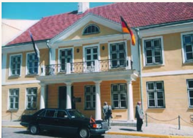
Saksa suursaadiku residents Tallinnas Toompeal.

Die Residenz des deutschen Botschafters auf dem Domberg in Tallinn.