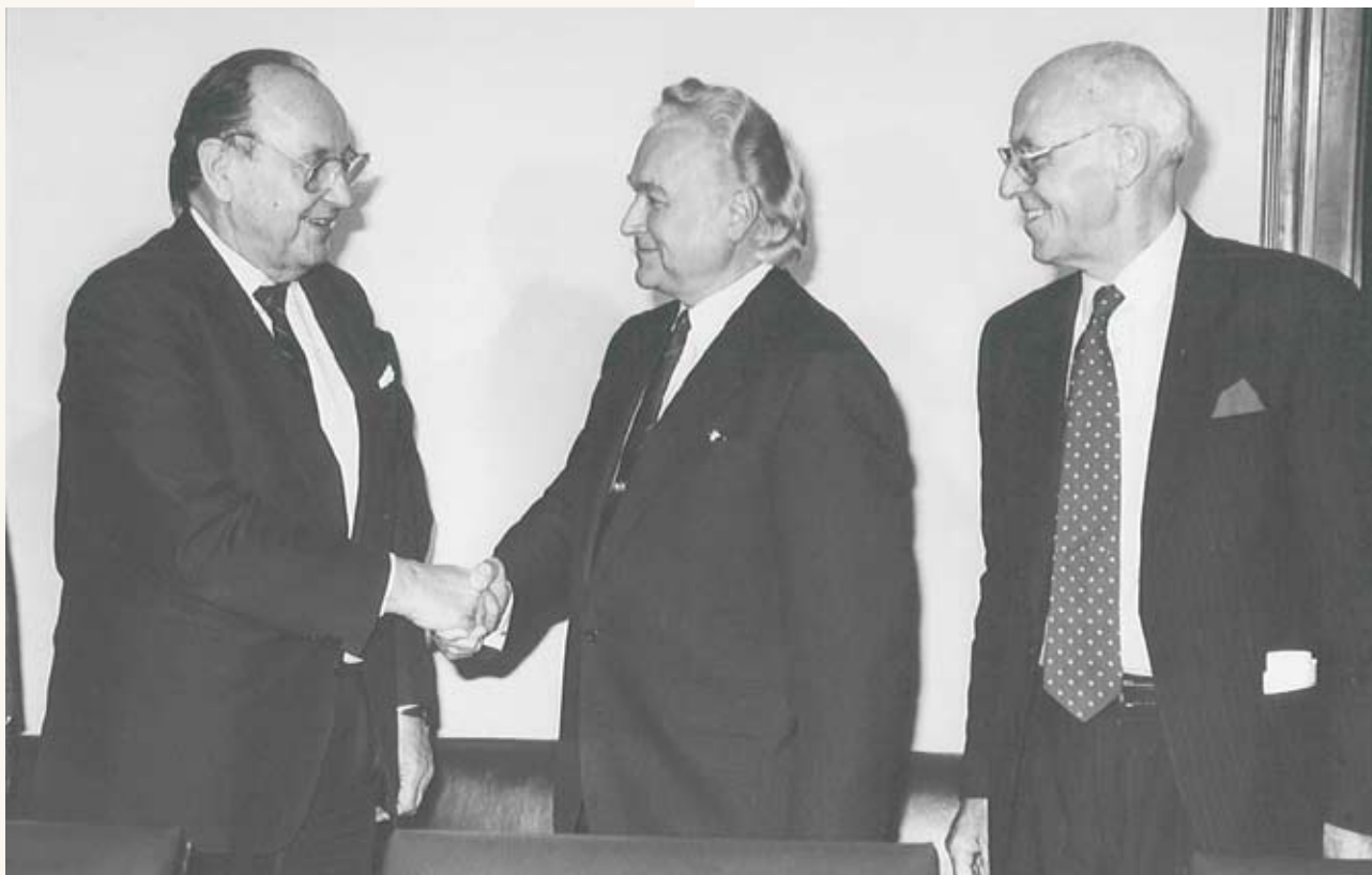
Saksa välisminister Hans Dietrich Genscher, Ülemnõukogu esimees Arnold Rüütel ja välisminister Lennart Meri. Tallinn-Kadriorg, 11. septembril 1991.