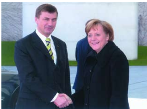
Liidukantsler Angela Merkel tervitamas peaminister Andrus Ansipit. Berliinis, 5. aprillil 2006.

Bundeskanzlerin Angela Merkel begrüßt den estnischen Ministerpräsidenten Andrus Ansip. Berlin, 5. April 2006.