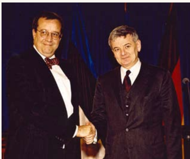
Saksa välisminister Joschka Fischer (paremal) tervitamas Eesti välisministrit Toomas H. Ilvest. Berliinis, 5. veebruaril 2001.

Juuni, november 1993 Peaminister Mart Laar Jaanuar-veebruuar 1994 Peaminister Mart Laar Märts 1994 Välisminister Jüri Luik Juuni 1995 Riigikogu esimees Toomas Savi, välisminister Riivo Sinijärv Oktoober 1996 Välisminister Siim Kallas August 1997 Peaminister Mart Siimann Mai 1998 Välisminister Toomas Hendrik Ilves Juuni 1998 Riigikogu esimees Toomas Savi Aprill, november 1999 Peaminister Mart Laar Juuli 1999 Välisminister Toomas Hendrik Ilves September 1999 President Lennart Meri September 2000 Välisminister Toomas Hendrik Ilves, Saksa-Balti välisministrite kohtumi- se raames November 2000 President Lennart Meri riigivisiit Jaanuar 2001 Peaminister Mart Laar Veebruar 2001 Välisminister Toomas Hendrik Ilves