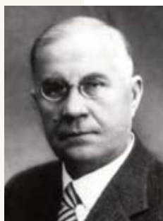
EDUARD VILDE 1919–1920

1919. aasta algul määras Ajutine Valitsus Vilde teadetebüroo juhatajaks Kopenhaagenisse ning sama aasta lõpus saadikuks Berliini. Saadiku ametist lahkus ta 1920. aasta lõpus ja töötas Berliinis edasi vabakutselise kirjanikuna. 1923 pöördus Eduard Vilde tagasi Tallinna ja töötas seal vabakutselise kirjanikuna. Eduard Vilde suri 26. detsembril 1933.