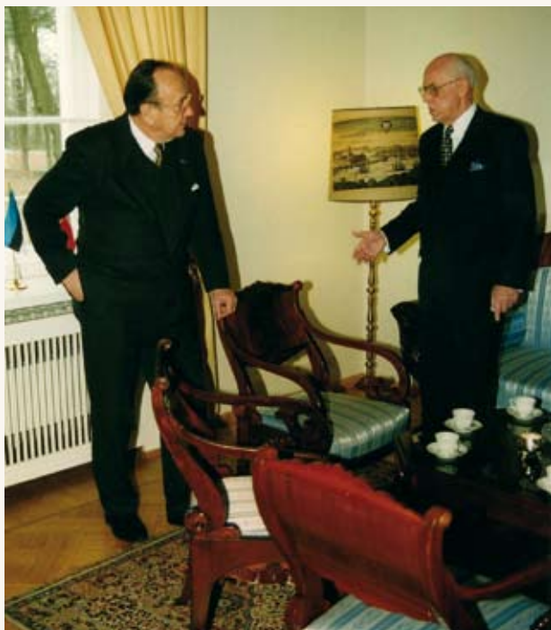
Hans-Dietrich Genscher (vasakul) ja Lennart Meri vestlemas.