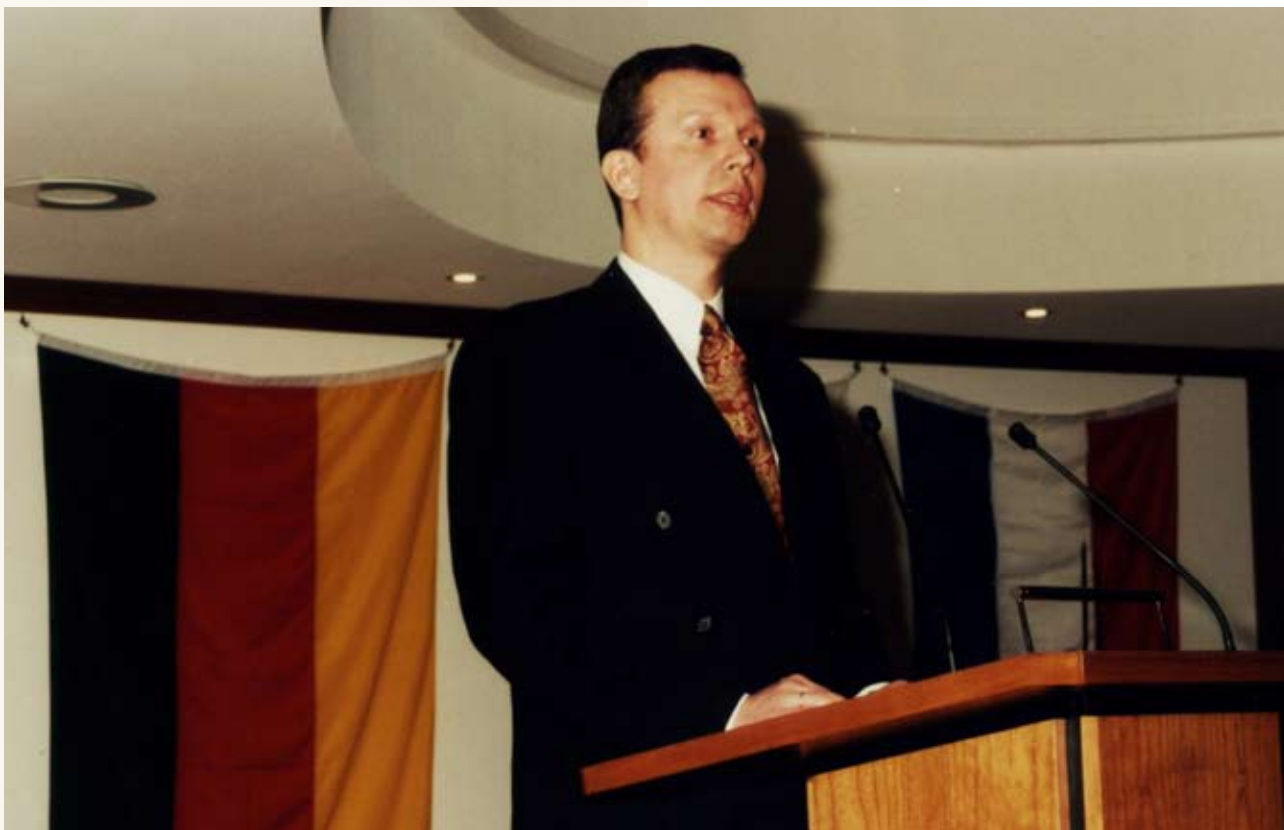
Suursaadik Margus Laidre aukonsulaadi avamisel. Kiel, 22. jaanuaril 1997.