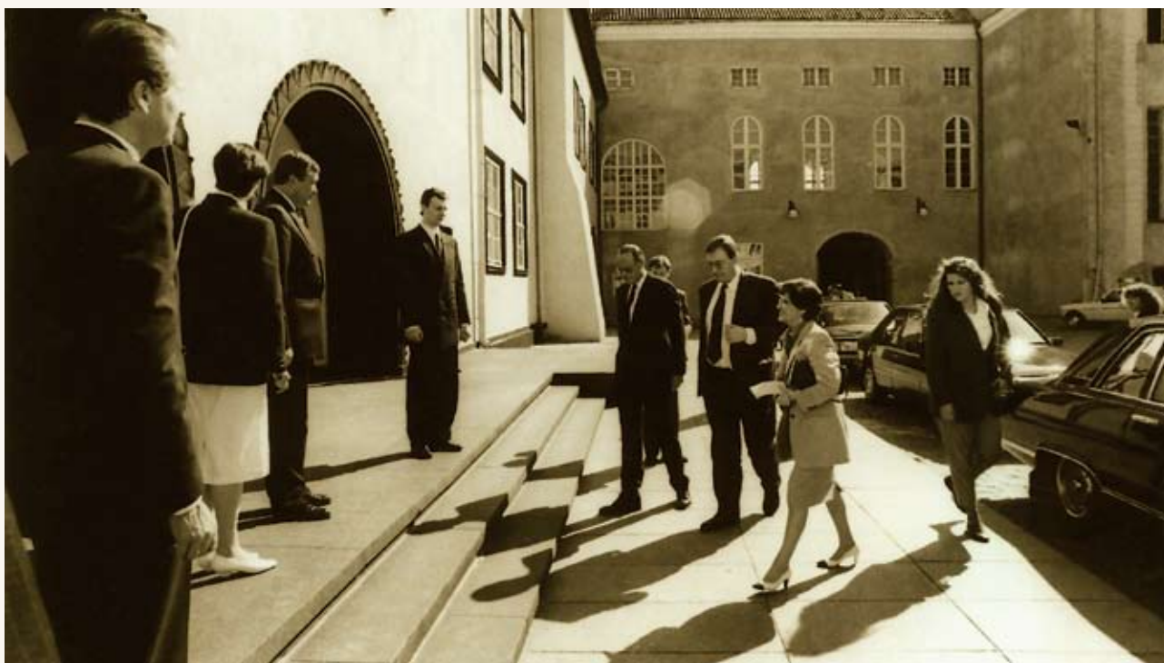
64 aastat hiljem samas kohas: Saksa Liidupäeva president dr Rita Süssmuth teel Riigikokku. Tallinn, 1993.