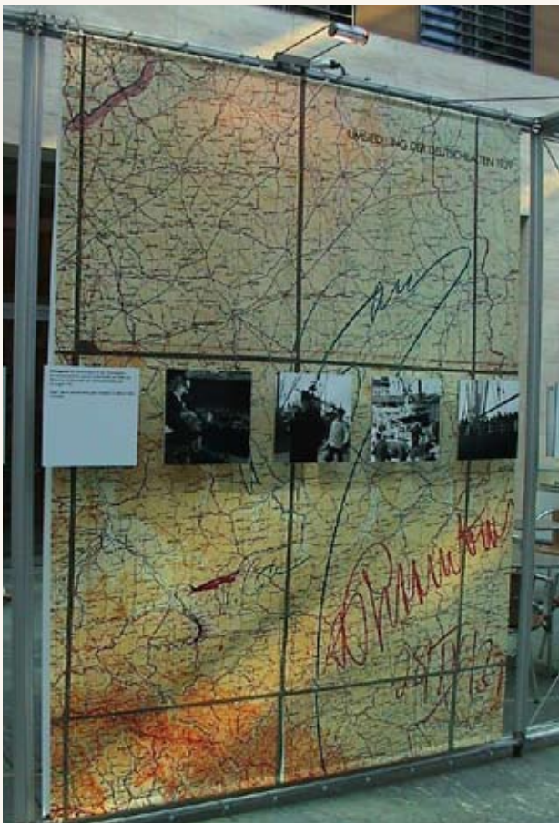
Fragment 22. septembril 2006 Berliinis Saksa Välisministeeriumi aatriumis avatud näitusest „Piiririikidest partneriteks Euroopas“: Huvisfääride eraldusjoone ja Stalini ning Ribbentropi allkirjadega Euroopa kaart, osa 23. augustil 1939 allkirjastatud mittekallaletungi paktist. Väikestel fotodel ümberasujate pardaleminek Tallinna sadamas 1939-1940.

Ein Fragment von der Ausstellung „Von Randstaaten zu Partnern in Europa“, die am 22. September 2006 im Lichthof des Auswärtigen Amtes in Berlin eröffnet wurde: Die Karte Europas mit der Trennungslinie der Interessensphären und den Unterschriften von Stalin und Ribbentrop als Bestandteil des Nichtangriffspaktes vom 23. August 1939. Auf den kleinen Fotos: Die Einschiffung der Umsiedler im Tallinner Hafen 1939-1940.