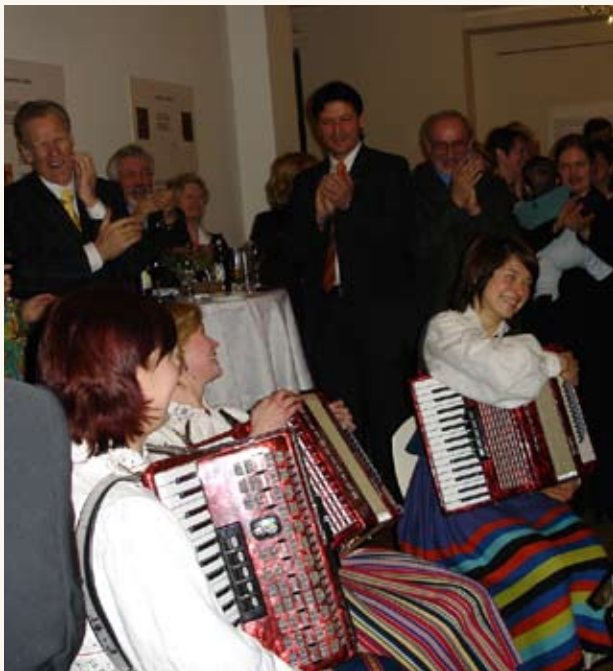
Neidude akordioniansambli ülemenukas etteaste Berliini Saksa-Eesti Seltsi korraldatud vabariigi aastapäevapeol veebruaris 2005.

Eesti valitsusele oli väga kiiresti selge, et edu saab tuua üksnes poliitilise ja majandusliku süsteemi täielik ümberkujundamine põhjapanevate reformide abil, ning nii oligi loogiline kutsuda appi mõni Saksa konsultatsioonifirma, mis oli sel alal uutes liidumaades juba kogemusi omandanud. Nii läksin ma 1992. aasta septembris lepingulise tõlgina Eestisse tagasi, et olla kohalike olude tundmise ja keeleoskusega abiks Treuhand Osteuropa Beratungsgesellschaft mbH Tallinna büroo rajamisel, mis pidi Eesti suurettevõtete erastamisel olema nõustajaks.