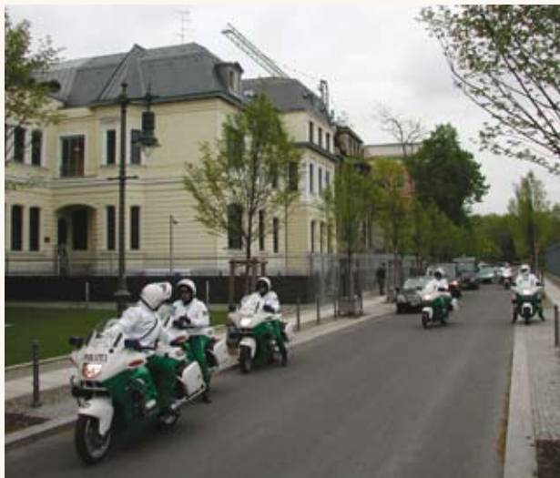
Saatkonna hoone Berliinis Hildebrandi tänaval majas 5.