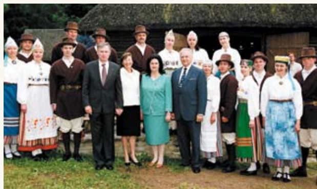
Liidupresident Horst Köhler ametlikul visiidil Eestis. Jaanituli Altjal, juuni 2005. Esireas: Horst Köhler (vasakult neljas), Eva Luise Köhler, Ingrid Rüütel, president Arnold Rüütel.

Mai 1999 Mecklenburg-Vorpommerni liidumaa peaminister dr Harald Ringstorff ja Schleswig-Holsteini liidumaa peaminister Heide Simonis Juuni 1999 Liidupäeva president Wolfgang Thierse September 1999 Välisminister Joschka Fischer Juuni 2000 Liidukantsler Gerhard Schröder August 2000 Mecklenburg-Vorpommerni liidumaa peaminister dr Harald Ringstorff September 2000 Liidunõukogu president ja Saksi Liidumaa peaminister dr Kurt Biedenkopf August 2001 Rahandusminister Hans Eichel November 2001 Kaitseminister Rudolf Scharping Detsember 2001 Mecklenburg-Vorpommerni liidumaa peaminister dr Harald Ringstorff Aprill 2002 Liidupäeva asepresident dr Antje Vollmer Juuni 2003 Mecklenburg-Vorpommerni liidumaa peaminister dr Harald Ringstorff September 2003 Berliini linnaepa Klaus Wowereit September 2003 Schleswig-Holsteini liidumaa peaminister Heide Simonis Juuni 2004 Schleswig-Holsteini liidumaa peaminister Heide Simonis November 2004 Liidupresident Horst Köhler Detsember 2004 Välisminister Joschka Fischer Mai 2005 Tüüringi Liidumaa peaminister Dieter Althaus Juuni 2005 Hamburgi linnaepa ja senati president Ole von Beust Juuni 2005 Liidupresident Horst Köhler Aprill 2006 Saksa Välisministeeriumi Euroopa asja-de riigiminister Günter Gloser