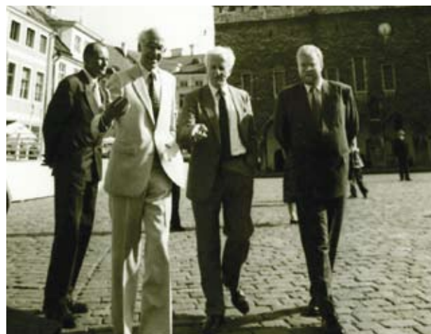
Liidupresident Richard von Weizsäcker visiidil Eestis. Tallinn, juuli 1993. Pildil: president Lennart Meri (vasakult), Richard von Weizsäcker, peaminister Mart Laar.