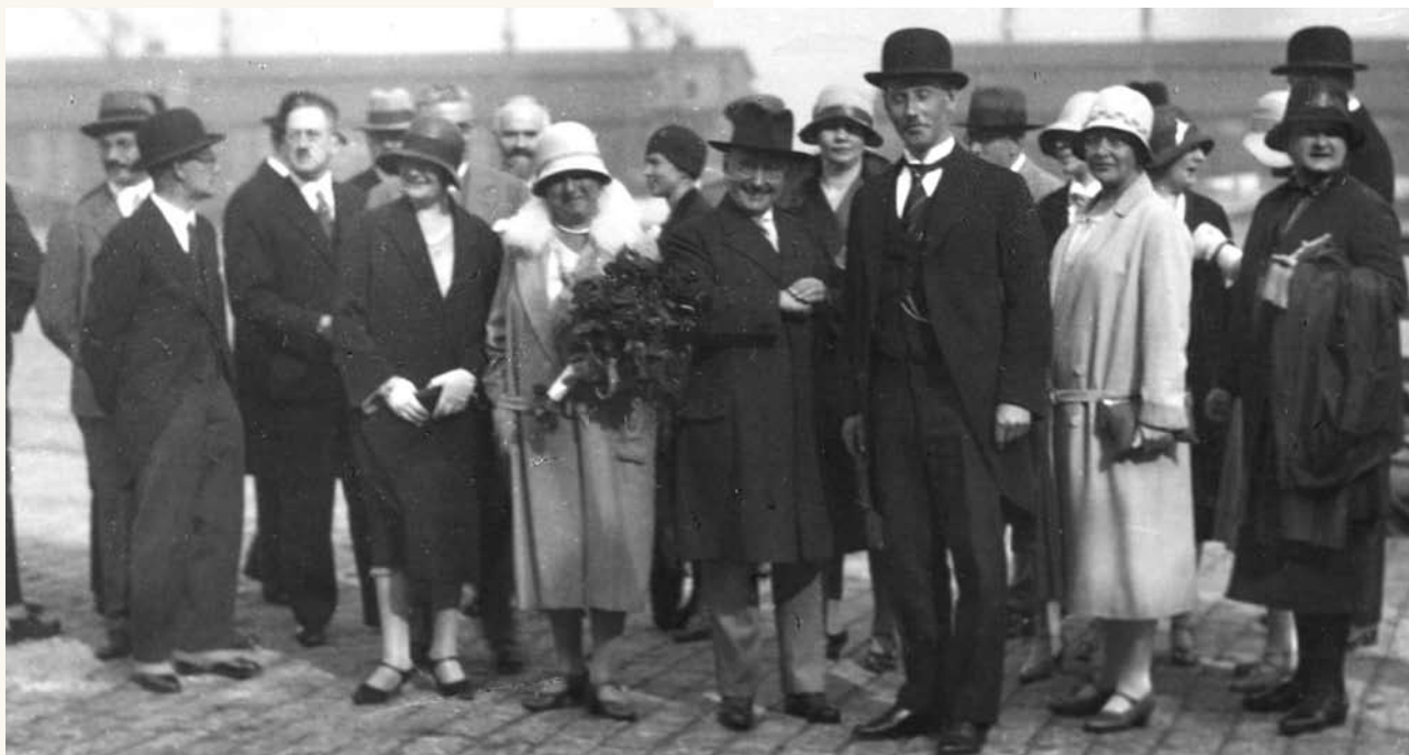
Saksa Riigipäeva president Paul Löbe (vasakult kuues) visiidil Eestis. Temast paremal Riigikogu esimees Karl Einbund (Kaarel Eenpalu). Tallinn, 1929.

Präsident des Reichstags, Paul Löbe (6. von links), besucht Estland. Rechts von ihm Präsident des Estnischen Parlaments, Karl Einbund (Kaarel Eenpalu). Tallinn, 1929.