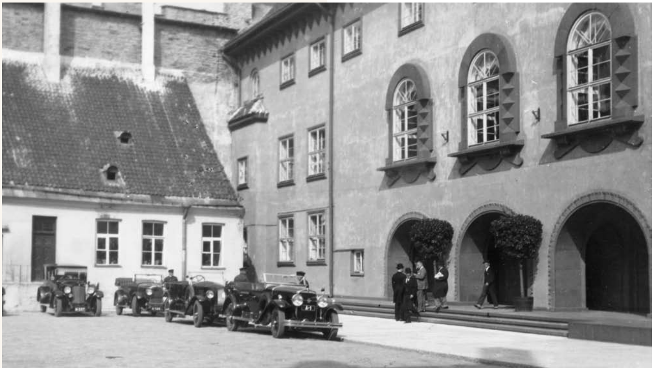
Saksa Riigipäeva president Paul Löbe Riigikogu hoovis. Tallinn, 1929.

Präsident des Reichstags, Paul Löbe, auf dem Hof des Parlaments. Tallinn, 1929.