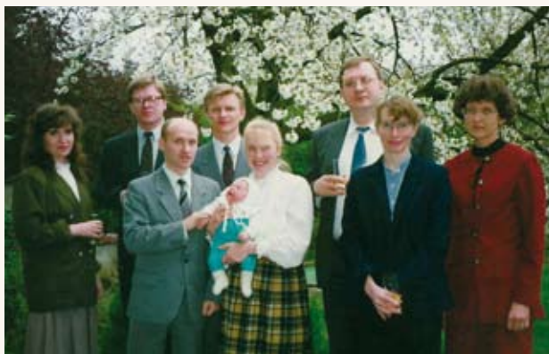
Esimesed aastad Bonn, aprillis 1993.