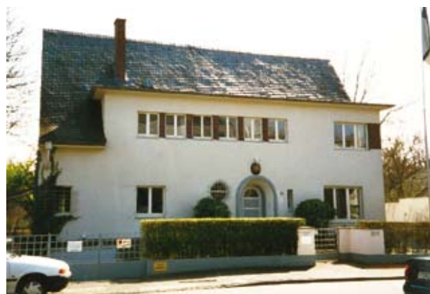
Saatkonna hoone Bonn Fritz Schäfferi tänaval majas 22.