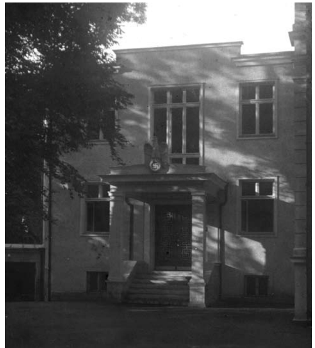
Sõjas hävinenud Saksa saatkonna hoone Toom-Kuninga tänaval majas 11.