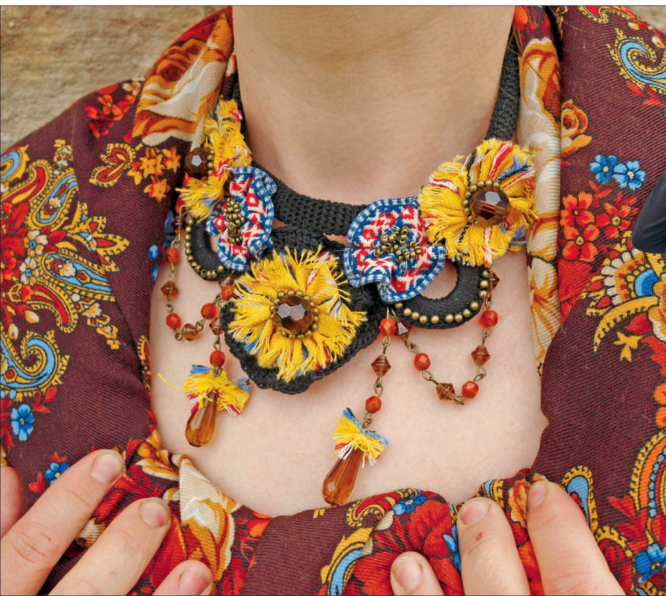
Kelle terav silm tunneb rosetis ära Lihula rahvariide seelikukanga?