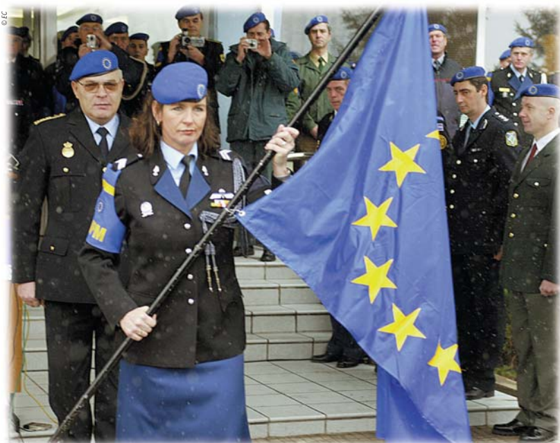
Eri riikide politseiametnikud aitavad Bosnias ja Hertsegoviinas kohalikul politseil korda pidada.

Kuid partnerluse puhul tuleb Euroopa Liidu lähinaabritele tagada lihtne juurdepääs laienenud ühistrule, kus on 450 miljonit tarbijat. See aitab kaasa naaberriikide kodanike elatustaseme parandamisele. Ühtlasi edendab see nende piirkondade demokraatlikke