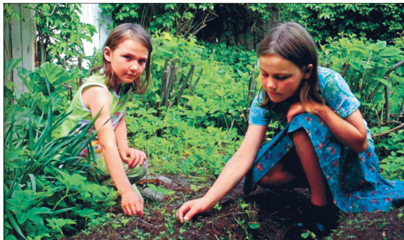
Säilitusporgandit harvendage jaanipäeval.