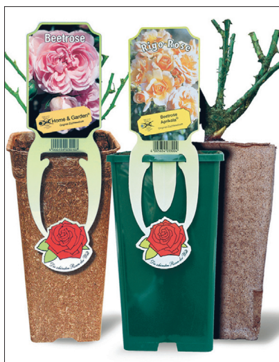
Plantofixi plastkonteineris on turbast ökopott, millega võib taime otse mulda panna. Turbapott muutub varsti niiskuse mõjul pehmeks ja laguneb.