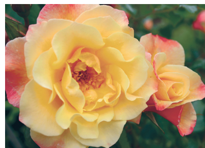
Uus roniroos 'Moonlight', mida võib kasvatada ka põõsana.

aga sees turbast ökopott. Mõne firma konteinerid on hoopis kartongist. Roositaimed istutatakse mulda koos traatkorvi, kartongkonteineri või ökopoti-ga, enne tuleb seda kuidagi korralikult leotada ja kärpida võrseotsi.