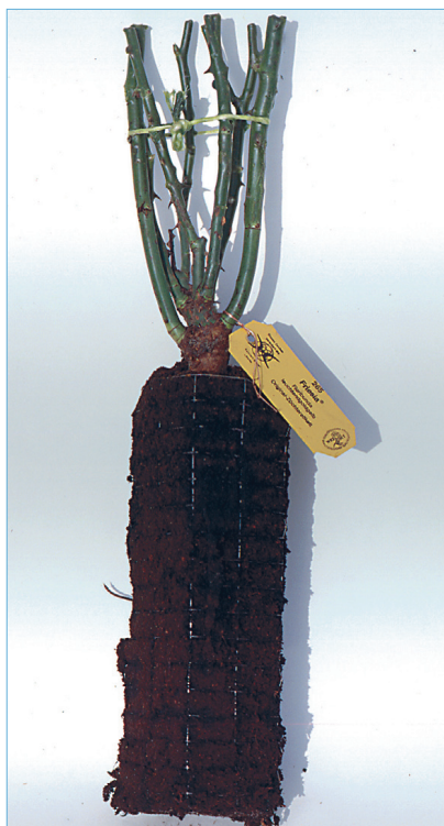
Turbapallis paljasjuurne taim istutage koos traatkorviga.