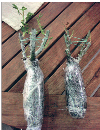
Kileümbri eemaldage kohe koju jõudes ja asetage taim 24 tunniks üleni vette.