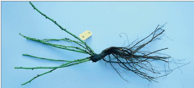
A-kvaliteediga istikul on kolm või enam oksa.

Paljasjuursete istikute parim istutus- ja ka ümberistutusaeg on kevadel alates aprillist ja sügisel oktoobris–novembris. Puhkeseisundis taime võrsed on rohelised ja ilma lehtedeta, seepärast võib ta kasvukohale panna varakevadel kohe, kui maapind on sulanud. Varajane istutusaeg on, võrreldes kasvuhoones ettekasvatatud külmaõrnade konteineritaimedega, suur eelis. Sügisel võib istutada seni, kuni maapind ei ole külmunud.