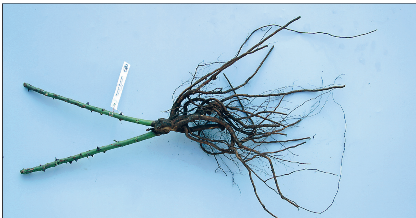
B-kategooria istikul on kaks haru.