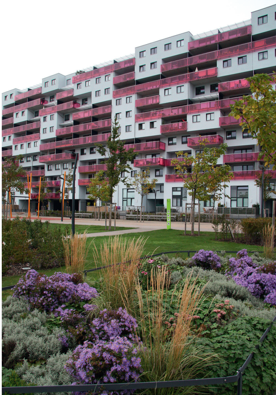
Moodsale arhitektuurile jääb rohkem ruumi linnasüdamest väljaspool, kuid läbimõeldud lahendused teevad ka kolossaalses kortermajas elu ilusaks.