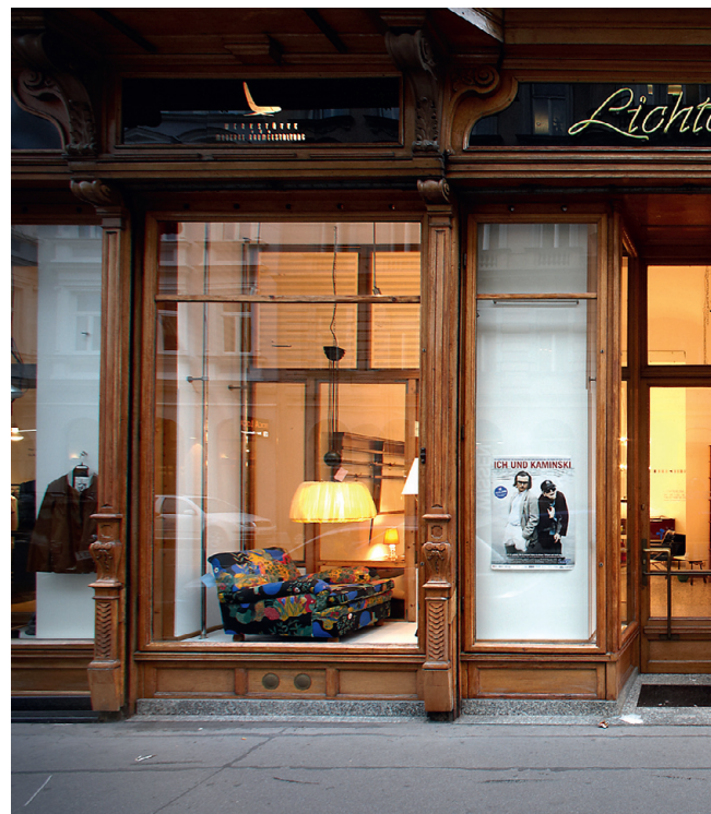
Mööbliidiler Lichterlochi valiku ajaloolisele ulatusele vihjavad ka teine, fotol olev, aga aastast 1886.

ÜKS KENA VIIS KEVADELE vastu minna on veeta nädalavahetus kaunis Austria pealinnas Viinis ning pikkida lillede ja linnulaulu vahele ka pildikesi kohalikul disainimaastikult.