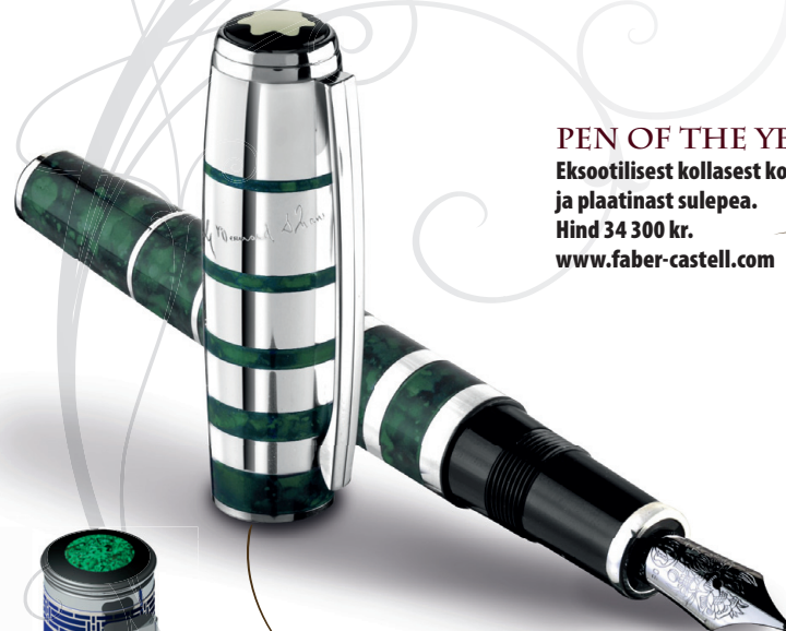
PEN OF THE YEAR Eksootilisest kollasest koldpuust ja platinast sulle. Hind 34 300 kr. www.faber-castell.com