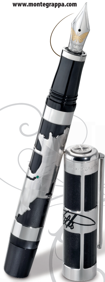
PAULO COELHO Mustast resiidist ja hõbedast sulle on pühendatud kirjanikule. Hind 25 000 kr. www.montegrappa.com