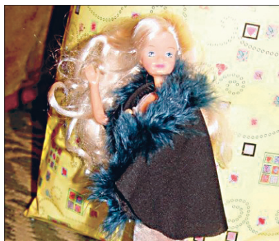
Pidulik keep nukule.