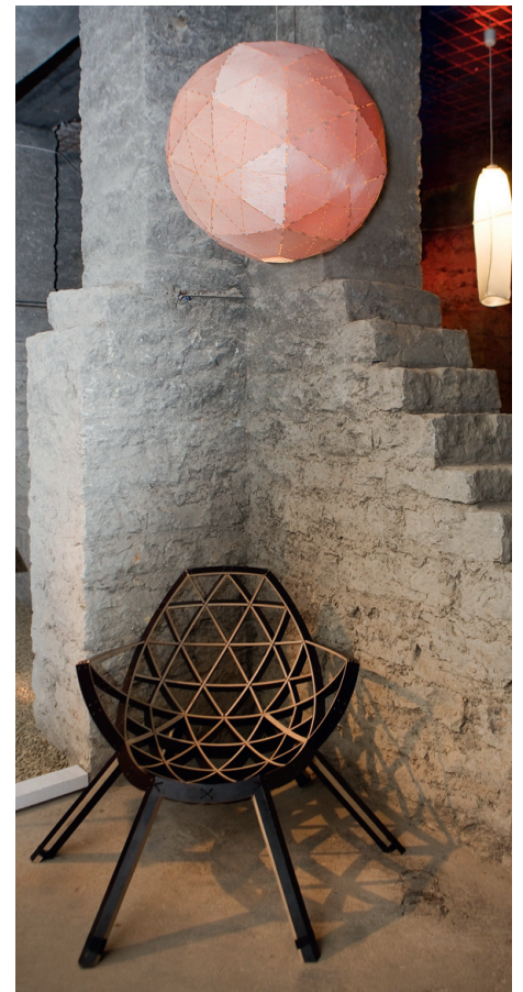
Disainer Jaanus Orgusaare loodud valgusti Galaktian ja munakoorjas tugitool Kelvin.