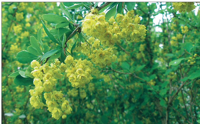
Harilik kukerpuu õitseb.

Kõige põnevam neist on vast 'Harlequin', mille lehtedelt leiab nasti vär-