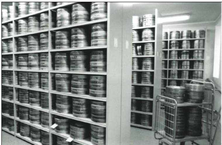
Vaade Filmiarhiivi renoveeritud hoidlasse