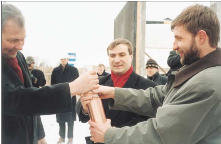
Ajalooarhiivi vahearhiivi hoone nurgakivi panek 12. märtsil 1999