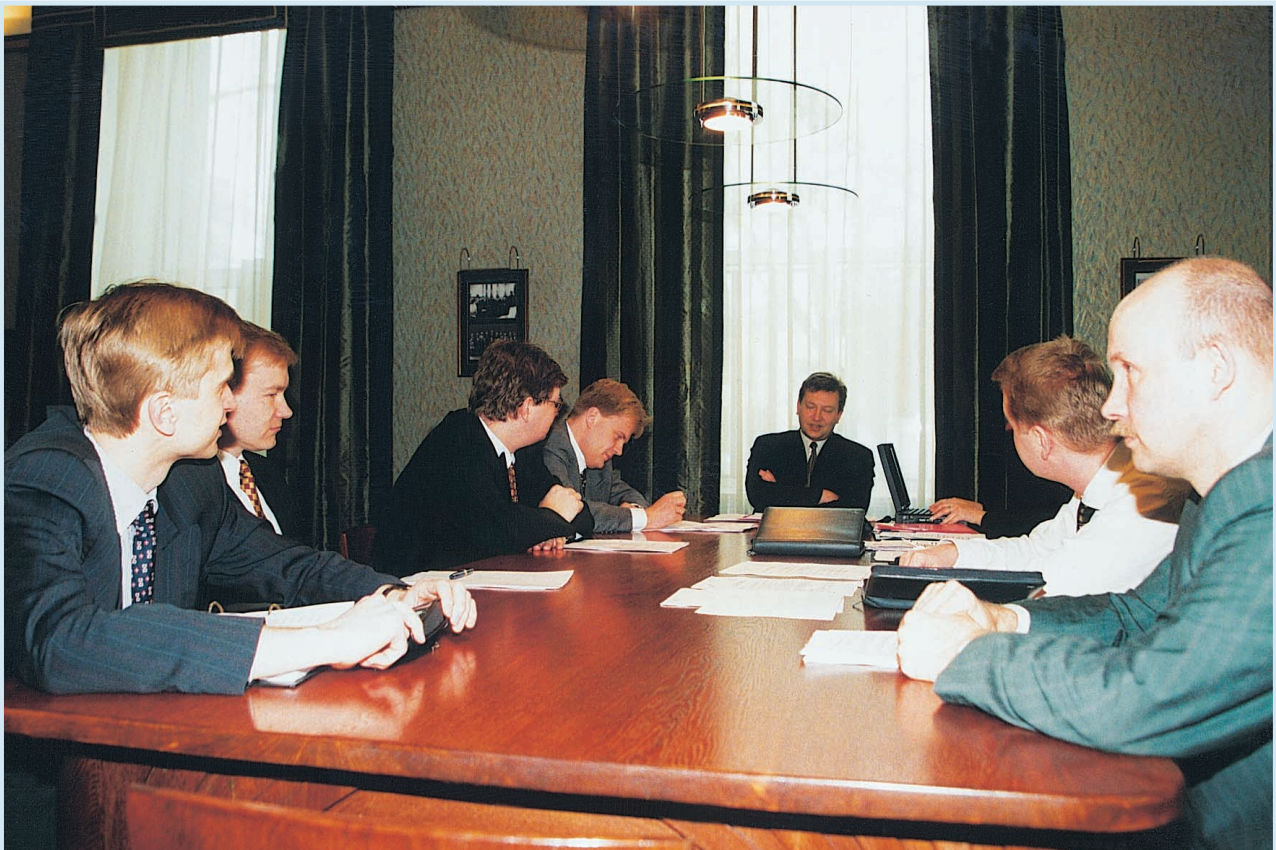
Nõu peab Eesti Panga juhatus.