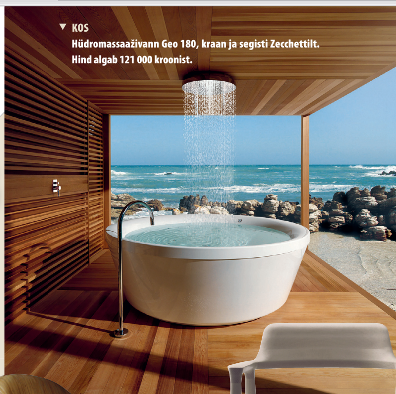
▼ KOS Hüdromassaživann Geo 180, kraan ja segisti Zecchettilt. Hind algab 121 000 kroonist.