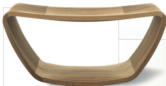
▲ CAPPELLINI Barber Osgerby disainitud pink kannab nime Hula. Hind 47 300 kr.

Riitsinusest valmib nüüd ka bioplastika, mille tootmisprotsessis kasutatakse troopilise põõsa seemneid. Ja Alcazar kasutas seda ökomaterjali oma uue lambikollektsiooni Illampadino loomisel. Kollektsiooni kuulub neli lambikuplit: lepatriinukujuline, kerakujuline (foto ülal), latern ja õhupall. Kui mõtlete tänapäeva moodsatele majadele, kus säästupirnid elektrijuhtmete otsas ripuvad ja kupleid ootavad, siis selle Milano firma värvilised ja ironilised lambikuplid, mis koosnevad kahest osast ümber pirni pesa, võiksid ootused täita. Hind algab 300 kroonist. www.illampadino.it