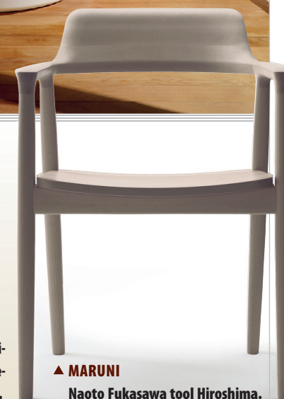
▲ MARUNI Naoto Fukasawa tool Hiroshima. Hinda küsi tootjalt. www.maruni.com