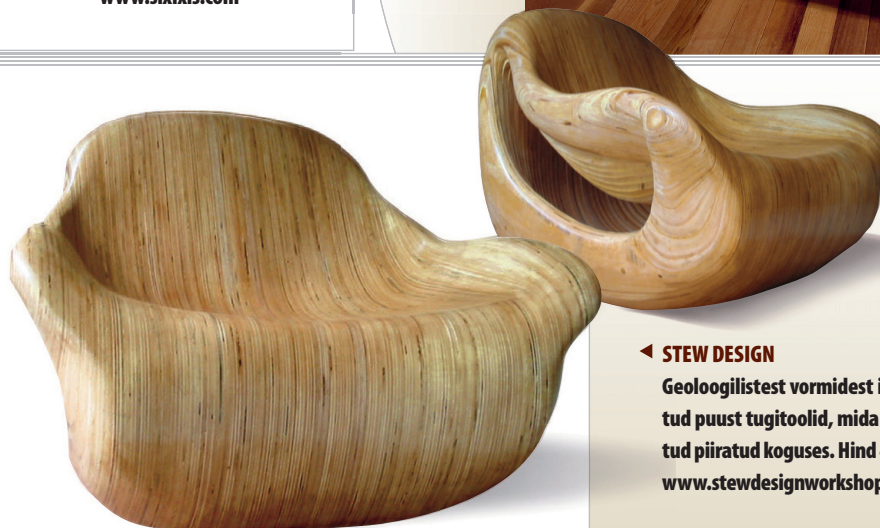
◀ STEW DESIGN Geoloogilistest vormidest inspireeritud puust tugitoolid, mida on toodetud piiratud koguses. Hind 46 600 kr. www.stewdesignworkshop.com