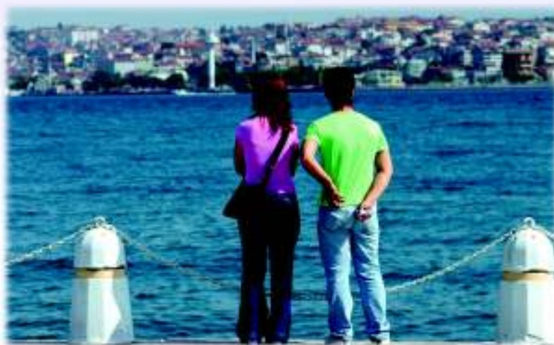
Istanbul: Türgi on ELi liikmekandidaat.

Lisaks kolmele kandidaadile on neli Lääne-Balkani riiki (Albaania, Bosnia ja Hertsegoviina, Montenegro ja Serbia) ELi potentsiaalsed liikmekandidaadid. EL on juba võimaldanud enamikule ekspordile kõikidest Lääne-Balkani riikidest vaba juurdepääsu oma turule ja toetab nende riiklike reformikavasid.