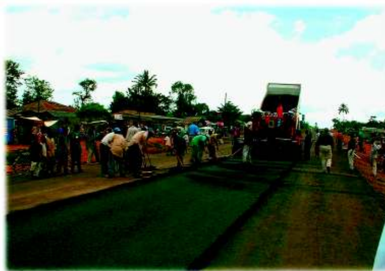
Ilmastikukindlatel maanteedel on Aafrika arengus elutähtis osa.

ELi ja 79 Aafrika, Kariibi mere ja Vaikse ookeani piirkonna (AKV) riigi erilisele kaubandus- ja abipartnerlusele pandi alus 1975. aasta Lomé lepingutega. Kõnealust partnerlust arendatakse edasi nn majanduspartnerluslepingute kaudu. Need lepingud ühitavad ELi kaubanduse ja abi uuel viisil. AKV riike julgustatakse soodustama majandusintegratsiooni ümberkaudsete naabritega kui samu nende ülemaailmse integratsiooni suunas, samal ajal kui abi antakse rohkem institutsioonide väljaarendamisele ja heale valitsemistavale. Majanduspartnerluslepingu alusel saab arengumööde ELi ja AKV riikide partnerluse nurgakiviks.