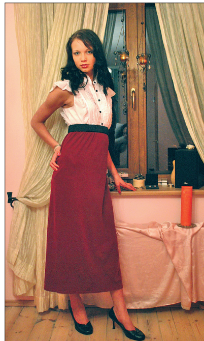
Kenast kangast õmmelduna ja koos sobivate lisanditega mõjub ka lihtne seelik pidulikult.

ne niit jääb kahe pisterea vahele siksakina. Kuna sirsed pisteread peavad jääma kindlasti pealmisele poolele, tuleb enne õmblema asumist palistus traageldada. Sissepoole pööratud palistus peab jääma lõikeservaga siksaki alla või väga lähedale (vt fotot).