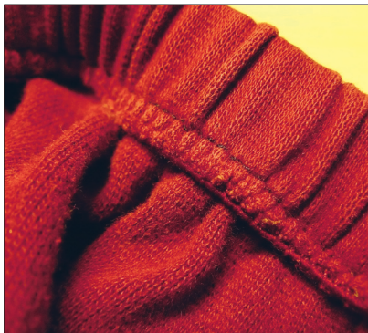
Ülemise ääre viimistlemine.