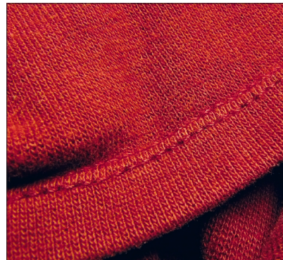
Alumine äär paremalt poolt.