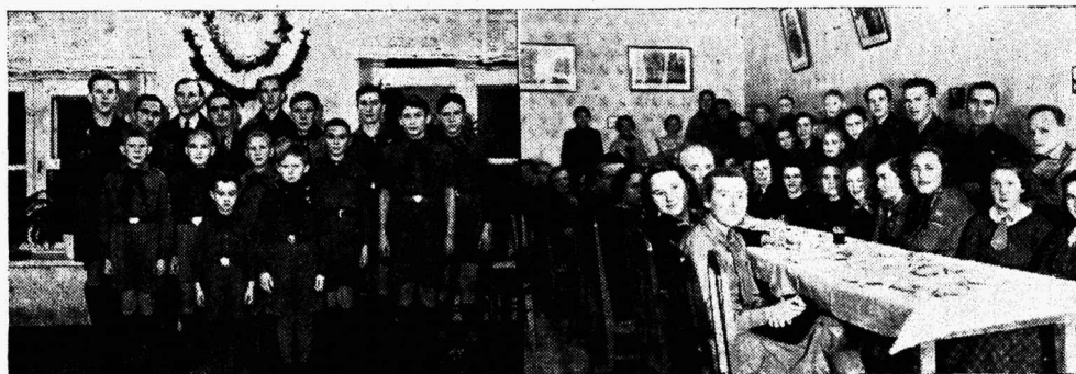
Tallinna Sk. Maleva poola skaute ja gaide