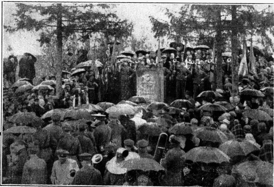
A. Õunapuu mälestussamba avamistalitusest osavõtjaid