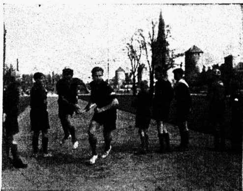
Moment Tallinna skautide ümberlinna teatejooksult

„Kaks: üks, meie võit!“ hüüab äkki kõige pisem poistest ja kohe hakkab master poisse pinnima esimese abiga. Teevad siis