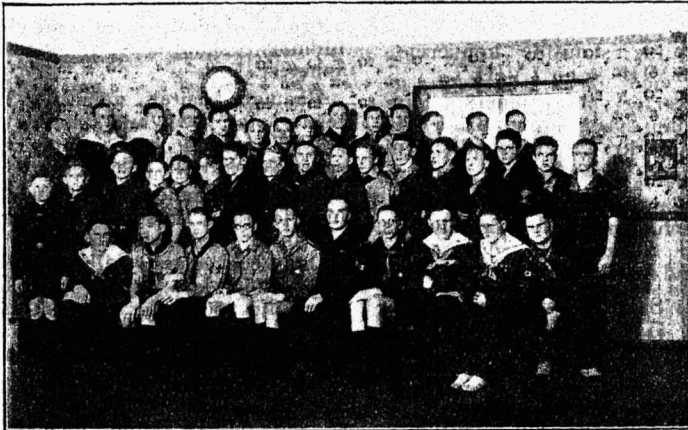
Pildil: Pärnu juhtide koolist osavõtjad.

Kaelarätt teeb skaudiriietuse värvirikkamaks. Skaut „naeratab ja vilistab raskustes olles ja kaelaside passib eriti naeratava näo juurde — tehes ka riie-tuse rõõmsamaks. Skaudi rätik tuletab meelde cowboy kaelarätti — skaut püüab jälgida metsmehe, pioneeri ja kõiki kes harrastavad elu looduse vabaduses.