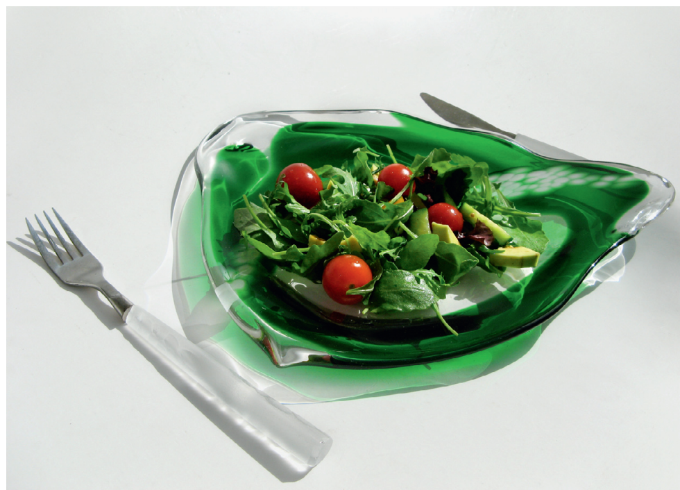
Bornholmi koolis tehtud salatitaldrik. Ka vana kahvel ja nuga said recycled art -projekti raames uued klaasist käepidemed.

on need kõik minu esimesed – esimene lõhnapudel, esimene vaas jne. Iga töö on omamoodi päevik, mis toob olukorrad, tegevused ja mõtted uuesti meelde.