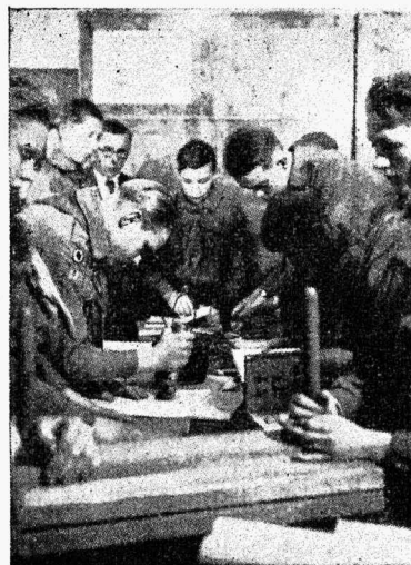
Noorkotkad raamatuköite töö.

— õppealaliste või oma erialaliste korralduste väljatöötamine ja nende elluviimine üksuse pealiku kaudu,