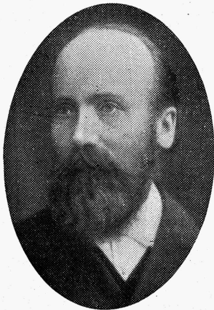
Dr. Jakob Hurt.

Eesti Aleksandri kooli asutamismõtte tähtsamaid eestvõitlejaid.