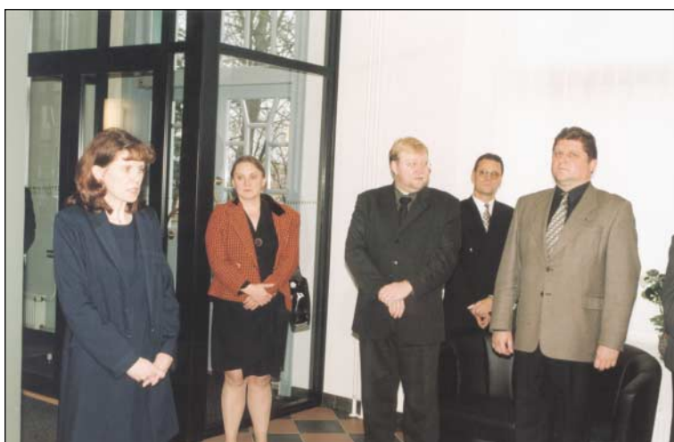
Hetk Valga Maa-arhiivi uue hoone avamiselt 17. novembril 2000