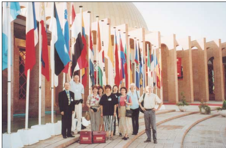
Rahvusarhiivi delegatsioon Rahvusvahelise arhiivinõukogu 14. kongressil. Sevilla, september 2000