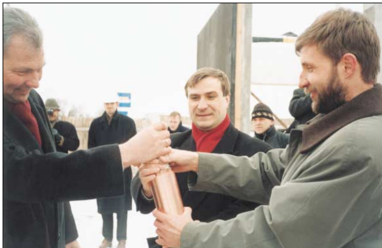
Ajalooarhiivi vahearhiivi hoone nurgakivi panek 12. märtsil 1999