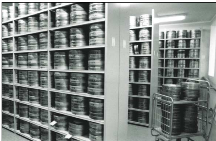
Vaade Filmiarhiivi renoveeritud hoidlasse