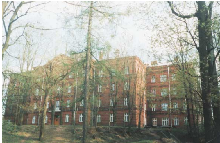
Ajalooarhiivi hoone Tartus