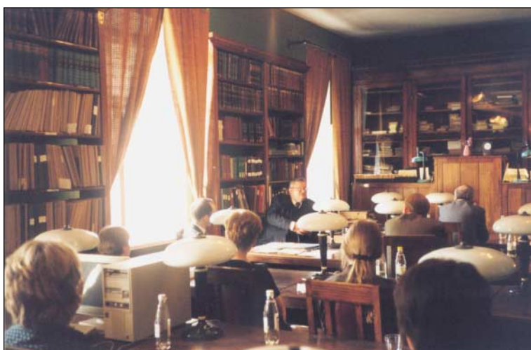
Kohtumine Ajalooarhiivi uurimissaalis Vene Föderatsiooni endise peaarhivaari Rudolf Pihhojaga. Mai 1999