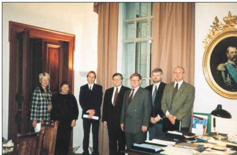
Külaskäik Soome Rahvusarhiivi. Oktoober 1999