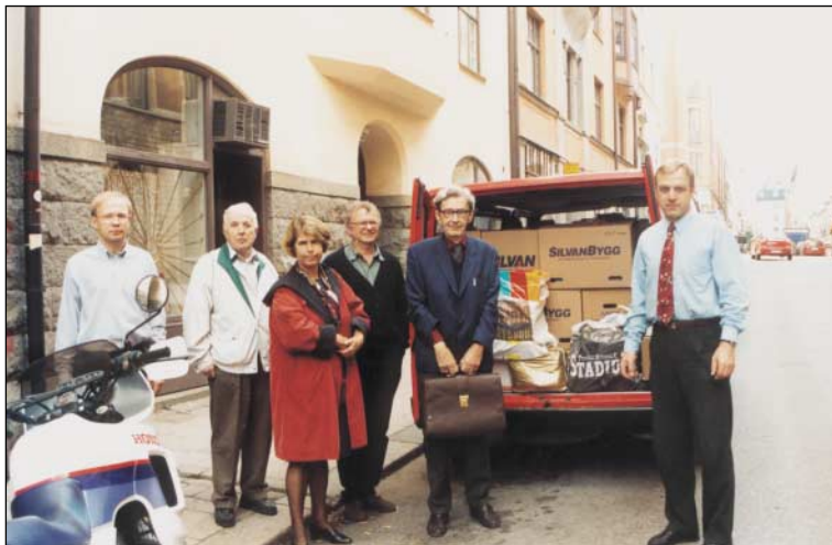
Eesti Sõjaveteranide Sõprusühingu arhiiv toodi Stockholmist Tallinna septembris 2000