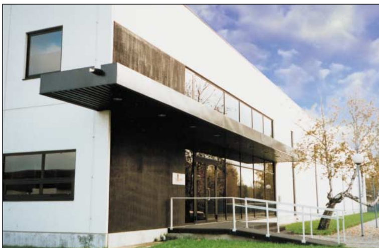
Ajalooarhiivi vahearhiivi hoone