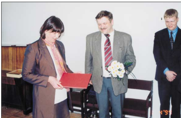
Lilled riigikokku valitud Aimar Altsaarele. Märts 1999