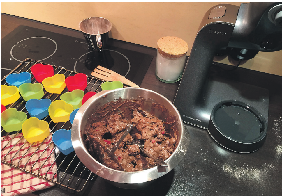
↑ KÖÖGIKOMBAIN peab hakkama saama nii keeksi kui ka pärmitainaga.

Mida ma teen. Küpsetan ja vahustan: tainad, sefiir, besee, biskviit. Soolased road, pasteet, hakkliha. Smuutid, jäätisekokteilid, püreesupid. Viilutamine, salatid jne. Ehk masin peab hakkama saama paljuga. Olen juba tühe köögikombaini manalateele minekus süüdi, kuna masin lihtsalt põles sefiiri vahustades sisse.