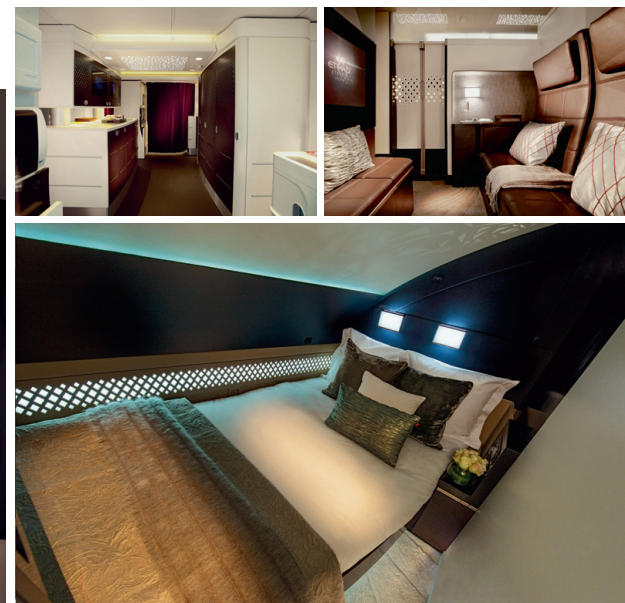
Vasakul The Residence'i nimelise kolmetoalise sviidi esik Etihad Airways A380 lennuki pardal. Üleval sama sviidi elu- ja magamistuba.

Lennukisemusele orienteeritud turg on juba mitmeid aastaid liikunud tõusvas joones. Ameerika grupi Markets&Markets andmetel tõuseb turu suurus 2019. aastaks 14 miljardi euroni, mis on eelmise aasta 11 miljardiga võrreldes üks korralik samm. Suured lennukompaniid investeerivad tohutuid summasid just sagedaste reisijate soovide mõistmiseks ja täitmiseks, niisiis