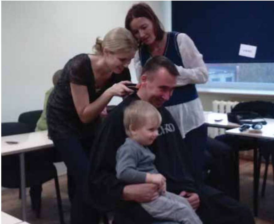
Kodujuuksuri koolitus Haapsalu Rahvaulikoolis.