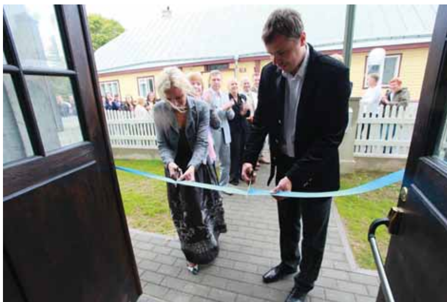
Lindilõikamine Läänemaa Ühisgümnaasiumi avamisel.