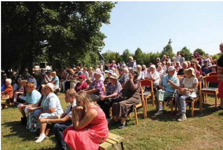
Pensionäride suvepäevad Rõudes.

Lääne Maavalitsus on olnud partneriks ja toeks Läänemaa pensionäride Ühendusele. 13. juulil 2013 toimusid pensionäride suvepäevad Rõude külaplatsil (osavõtjaid üle 500) ning jõulukontsert Haapsalu Kultuurikeskuses koos Rahvusooperi tähtedega.