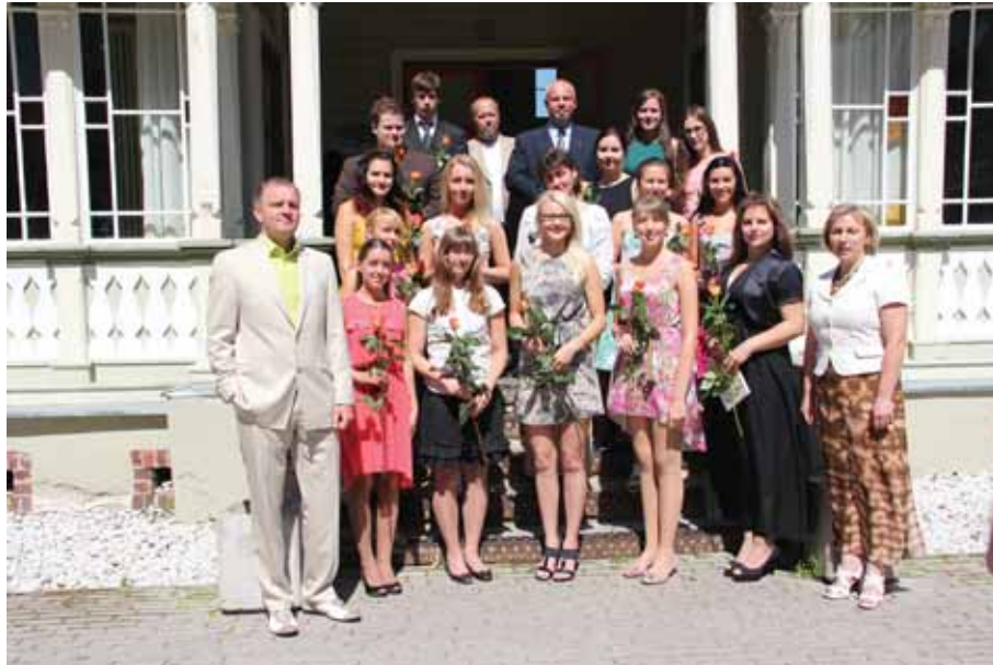
Parimad koolilõpetajad Haapsalu kursaalis.

2013. aastal sai Läänemaal medali 16 koolilõpetajat.