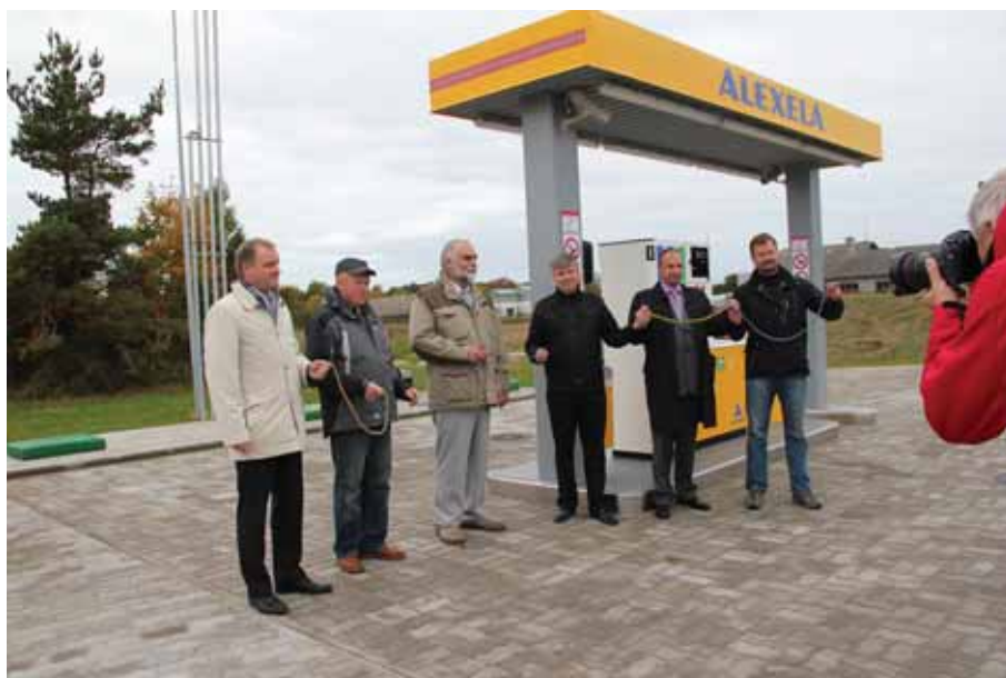
Veel üks esimene...2013. aastal avati Vormsil ka esimene tankla.