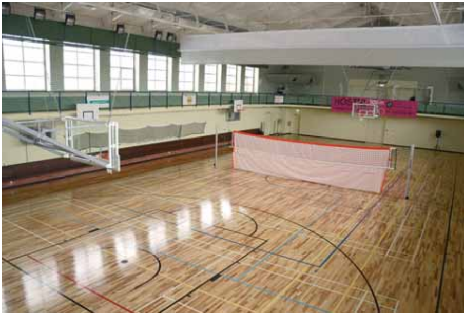
Haapsalu Kutsehariduskeskuse uus spordihall.