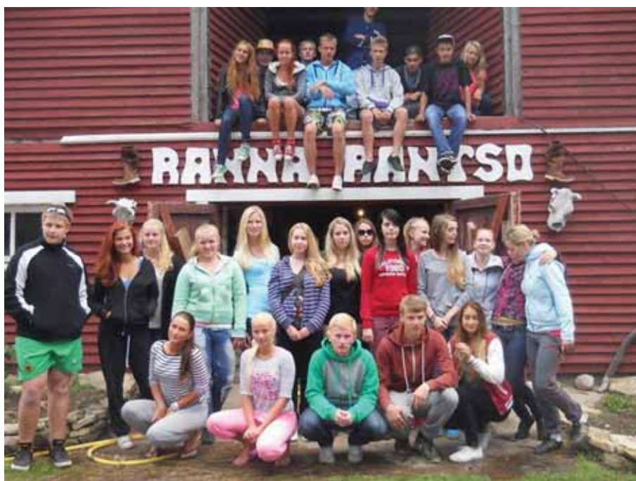
Läänemaa õpilasmaleva noored Ranna Rantsot külastamas.

Koostöös partneritega korraldati üle-Eestiline mini- ja õpilasfirmade lõppvõistlus 24. aprillil Haapsalu Kultuurikeskuses. 08.-23.juulil toimus ettevõtluse suunaga Läänemaa Õpilasmalev 17 noorele vanuses 14-18 aastat.