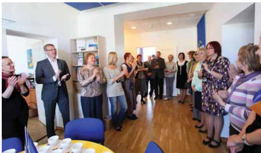
Europe Direct teabekeskus – Läänemaa avamine Lääne maavalitsuses.

Esmakordselt hakati Lääne maakonnas 2013. aastal süsteemselt tegelema Euroopa Liidu alase teavitamisega. Lääne maavalitsuse II korrusel avati 8. mail infopunkt, kus saab tutvuda Euroopa Liiduga seotud uudiskirjadega, erinevaid valdkondi tutvustavate trükistega ja täiendavalt uurida Euroopa Liidu kohta internetist.