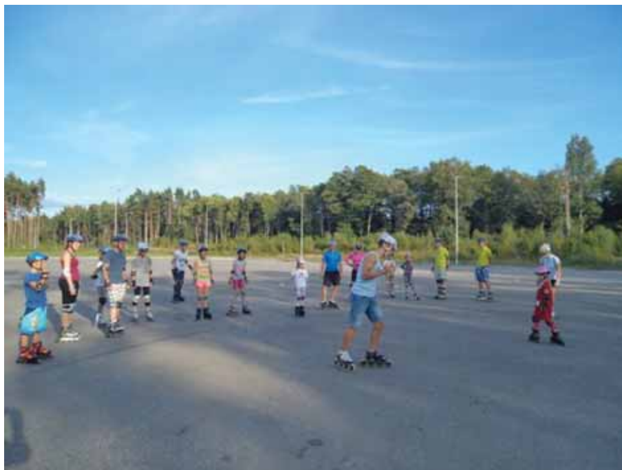
Rulluisu koolitusel oskusi omandamas.

2013. aastal tehti tihedat koostööd kehalise kasvatuses aineseksiooniga. Aineseksioonile saadi toetust omavalitsuste liidust 1500 eurot.