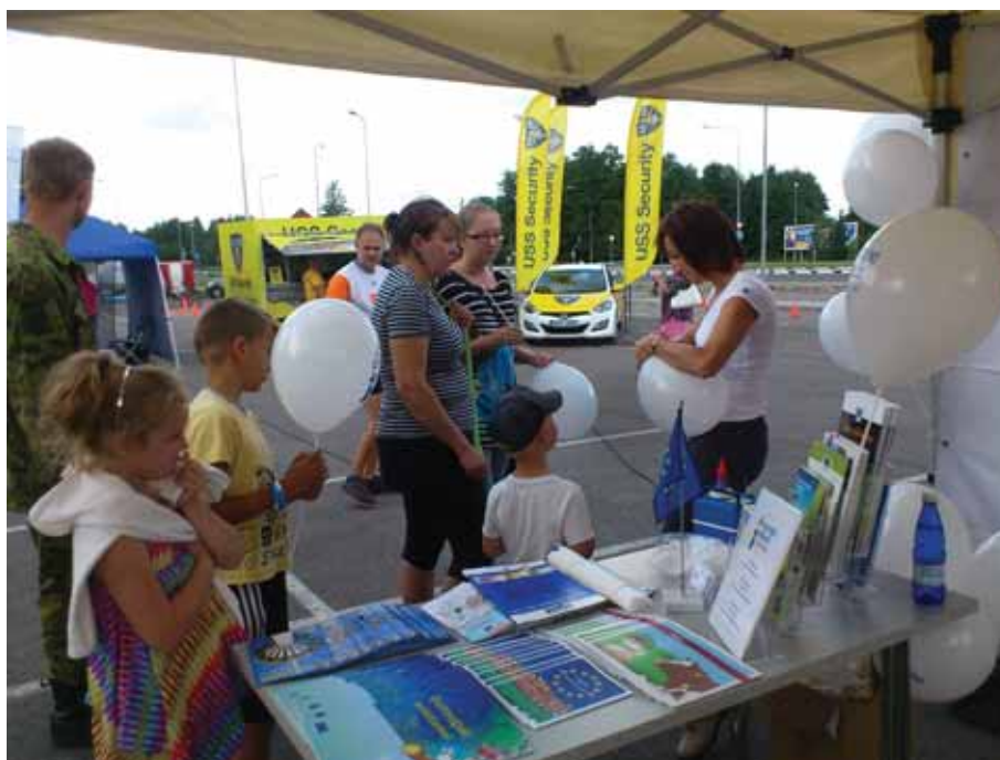
Europe Direct teabekeskus – Läänemaa Ohutuspäeval.

Europe Direct Läänemaa infopunkti tegevused aitavad täita Vabariigi Valitsuse seadusega maavanemale pandud kohustust korraldada maakonnas Euroopa Liiduga seonduvat teavitustegevust. „Europe Direct teabekeskus – Läänemaa“ on viieaastane projekt (2013-2017), mille tegevusi toetab Euroopa Liit, kaasrahastajateks on Siseministerium, Riigikantselei ja koostööpartnerid maakonnas.