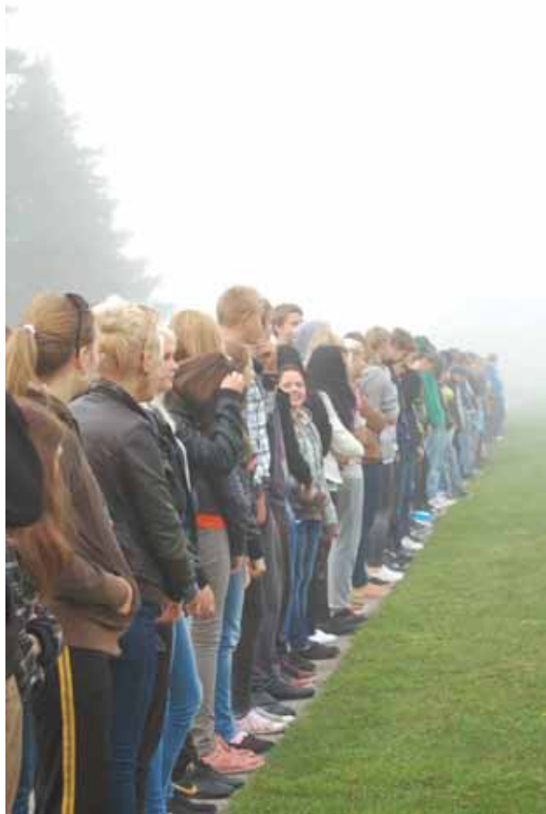
HKHK esmakursuslased kohanemislageris Tuksis.