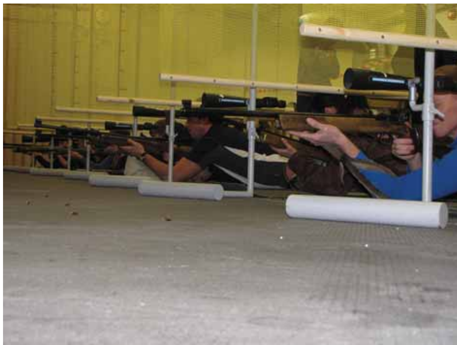
Firmaliiga tulejoonel.

Veebruarist oktoobrini toimus Läänemaa 9. firmade karikasari. Osales 18 ettevõtet/firmat/asutust. Võisteldi 15 spordialal. Olemuselt liikumisharrastuslik sari on populaarne Haapsalu piirkonnas.