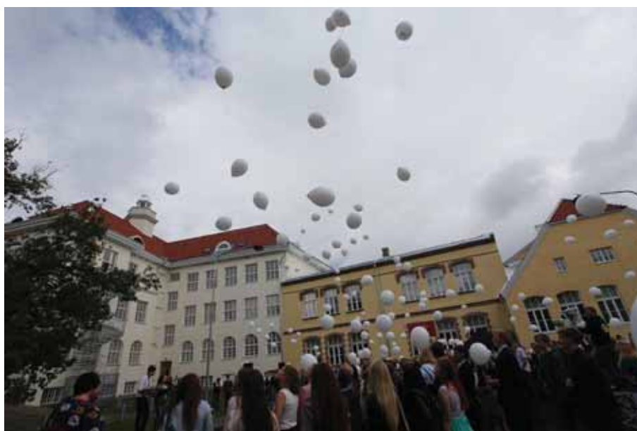
Läänemaa Ühisgümnaasiumi avamine.

Oligi alanud esimene õppeaasta, millele järgnesid tegevused, mille puhul võib uue kooli mõistes kõigil juhtudel kasutada sõna „esimene“.