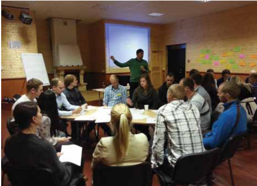
L.E.N.K.S.u (Läänemaa Ettevõtlike Noorte Koostöö Selts) sügisseminar Tuksis.

Nõustati 126 MTÜ-d, muuhulgas nende 33 projekti, millest 16 said rahastuse. Korraldati Läänemaa Kodanikuühenduste nädal, konverents ja 12 sädeinimese tunnustamine Haapsalu Kultuurikeskuses. Viidi läbi MTÜ-de Mentorklubi koos Hiiumaa arenduskeskusega TUURU - osales 10 mentiidi ja 3 mentorit. Toetati Läänemaa Käsitöö Liidu ja Läänemaa Ettevõtlike Noorte Koostöö Seltsi tegevuse käivitumist koosolekute ettevalmistamise, läbiviimise ning ürituste korraldamisega.