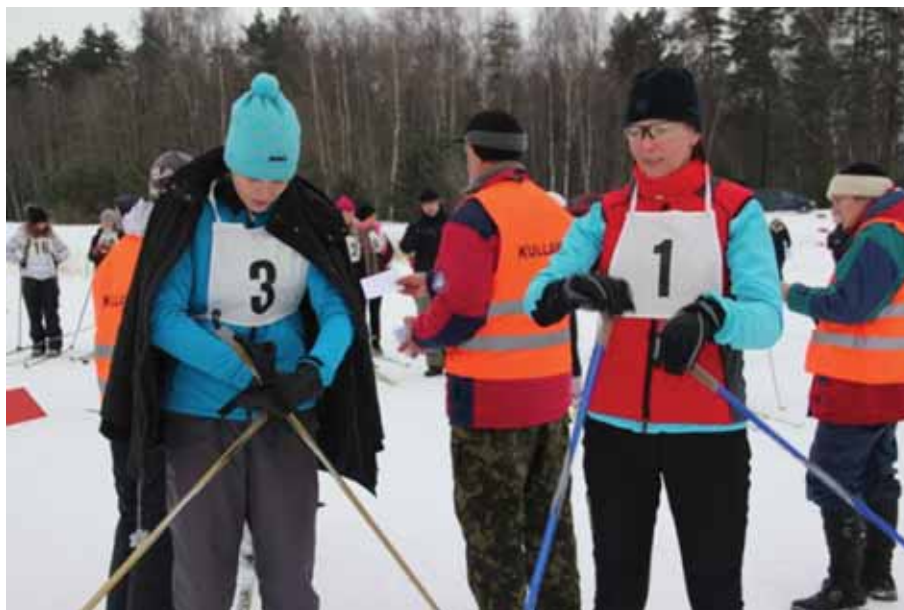
Suusastardi ootel Läänemaa 19. Talimängudel.

1.-3. märtsini toimusid 12. Eestimaa Talimängud Võrus. Läänemaalt osales 50 sportlast. Eestimaa 12. Talimängudel toodi medaleid lauatennises, maadluses ja ujumises. Maakonda esindasid korvpallurid, lauatennisistid, ujujad, kreeka-rooma maadlejad, suusatajad, suusaorienteerujad ja motokrossisõitja.