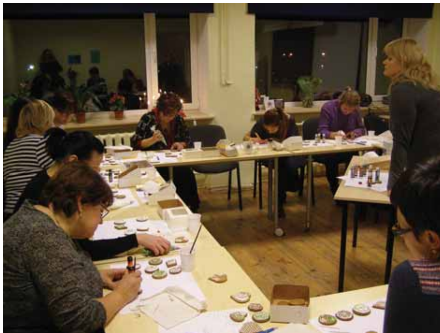
Piparkookide kaunistamise kursus.