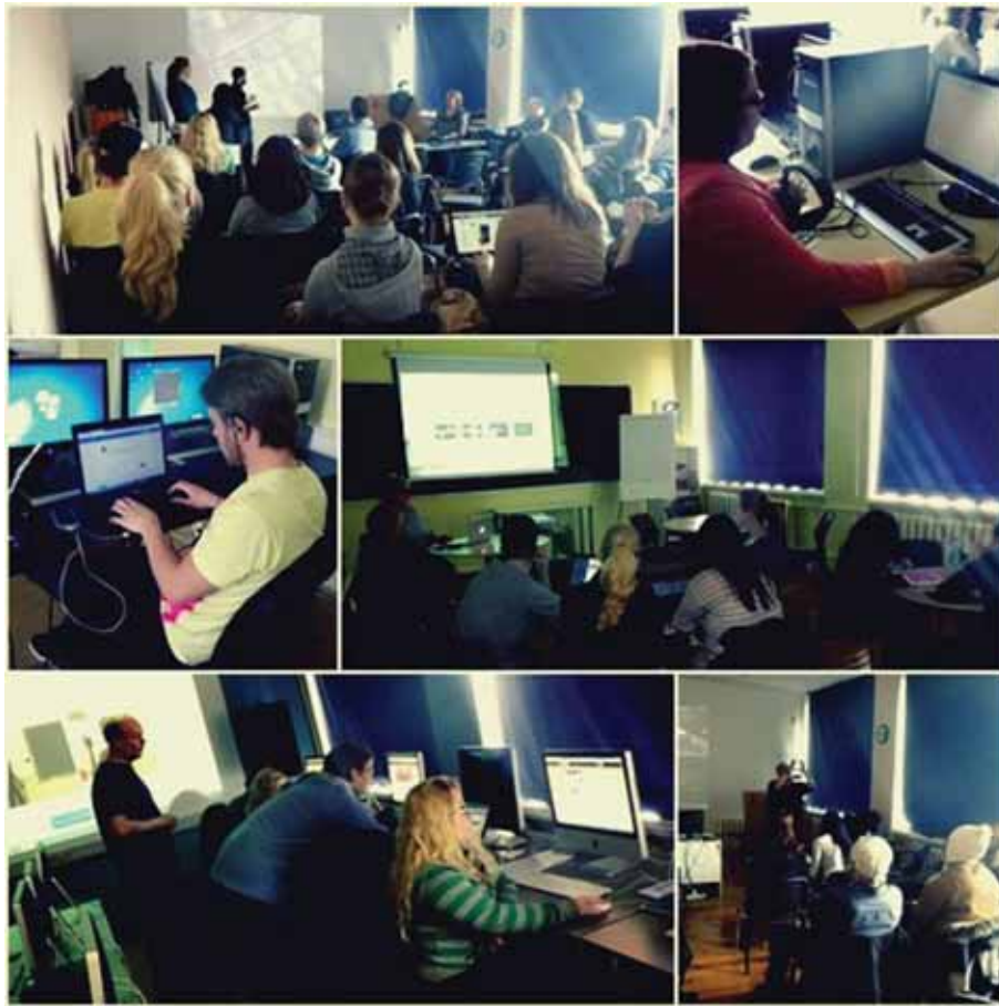
Üliõpilased õppimas EPE (easy production educational) video loomist töötubades.