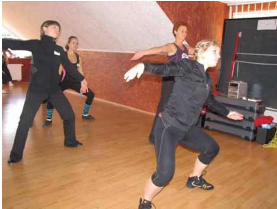
Võimlemise koolitus.

Veebruarist oktoobrini toimus Läänemaa 9. firmade karikasari. Osales 18 ettevõtet/firmat/asutust. Võisteldi 15 spordialal. Olemuselt liikumisharrastuslik sari on populaarne Haapsalu piirkonnas.