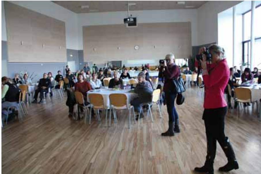
Koolisööklate tunnustamine Toidukonverentsil 04. 10 2013.