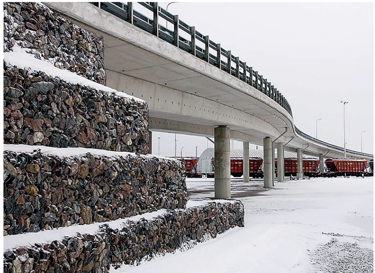
↑ MUUGA sadama viadukt.