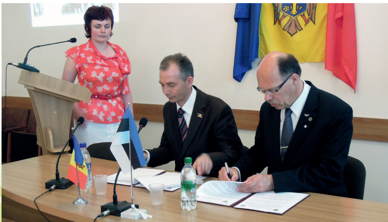
Koostöölepingu allkirjastamine Moldova Vabariigis.