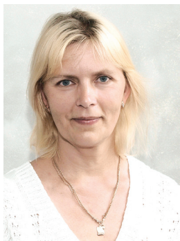
Aime Meltsas Juhataja asetäitja