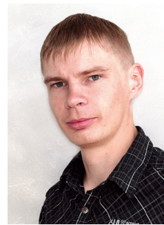
Anti Tõll Planeeringute peaspetsialist