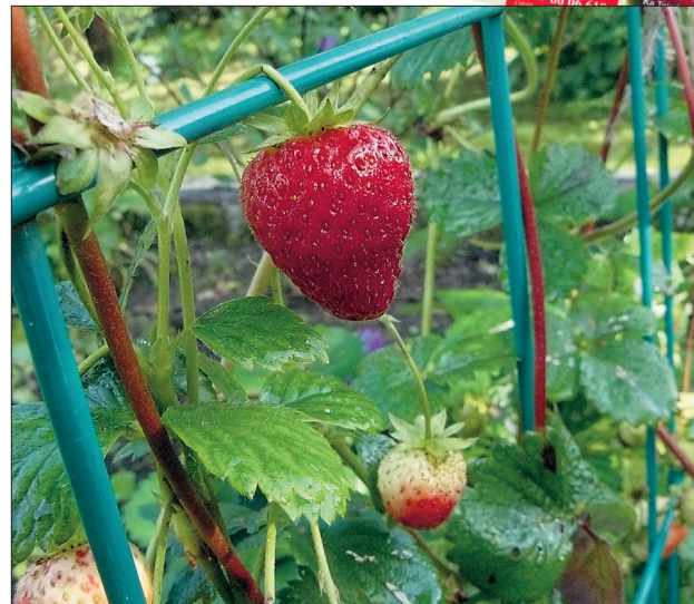
25. septembril võis võrestikult veel noppida selliseid maasikaid.