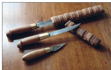
Sepistatud teravad noad.