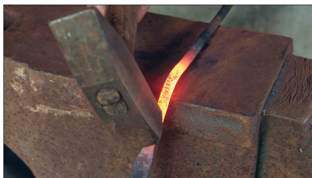
Septatöö käib tule ja vasaraga.