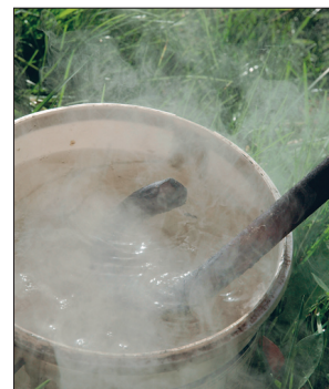
Sepis läheb vette jahtuma.