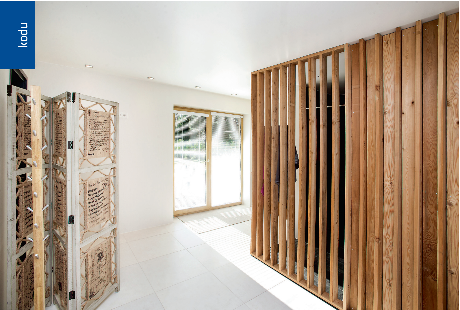
Puidu taha on peitunud väike saunaruum, avarast klaasukest pääseb otse päikeseo- jale terrassile.

mastus. Kavalalt on ära peidetud suurel hulgal panipaiku, kuhu argiesemed silma alt ära tõsta. Valgustite otsimiseks võiks mitteteadjale korraldada detektiivimängu, need on nimelt suures osas LED-valgustite võimalusi kasutades servade all, taga, sees, pakkudes öhtuti rahulikku taustavalgust. Seda, kus asuvad kapid ja panipaigad, pole samuti esmapilgul märgata, puuduvad nimelt käepidemed.