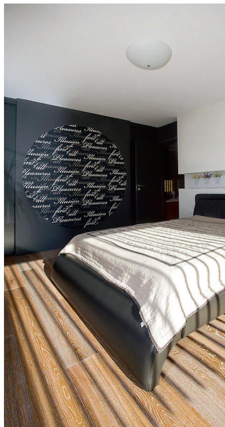
Magamistuppa langevat päikest triibutavad kogu ülemist korrust katvad puitribid.

Akent avades kostab kõrvu natuke puudesahinat, aimatavalt merekohinat ning üksik kajakahõige. Maja on rahulik, tunne värviline, miski ei sega naudisklust siin Kakumäel.