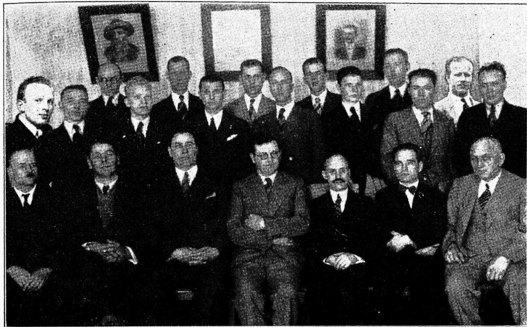
T. T. Ü. meeskoor.

Varakevadel, kavatseti asutada trükitöolistest koosnev meeskoor. Meie koorile oli hinge sissepuhumine seotud kaunis suurte „seletamiste ja nõupidamistega“. Enamus arvas, et ega sest ikka midagi välja ei tule — laulumehed laulavad teistes koorides, neil pole aega oma kooriga (s. o. trükitööliste kooriga) jännata. Teised aga soovisid seda.