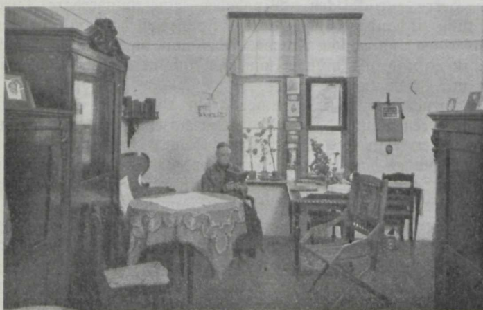
Esssaal in ein Zimmer unseres Altersheims.

Wie auch schon früher, sind allmonatlich im Heim Gottesdienste gehalten worden, zuweilen verbunden mit einer Abendmahlsfeier.