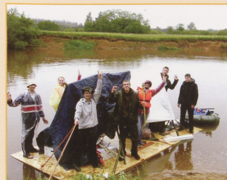
Kogu matkaseltskond parvel.