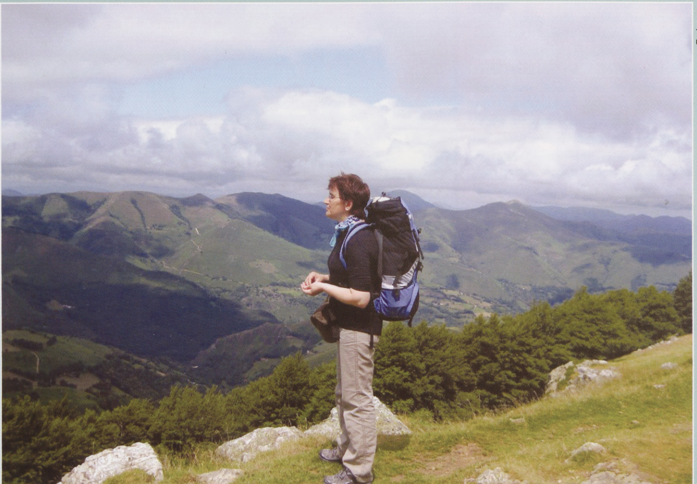
Starting the journey of 276 km.

If you are interested to know more about Camino de Santiago , you are welcome to read about it from internet at www.caminodesantiago.me.uk . The website includes a description of different routes, a packing list for pilgrims, information about pilgrim hostels, Camino Forum and Camino Blog. Find out and maybe we will meet on those routes next summer!