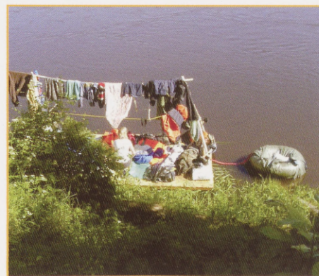
Tõsine veepuhkus, siin veel kodumaa vetes.

vesi, männimetsad. Parvetajad seadsid oma päevaplaani paika sõltuvalt sildadest. Iga