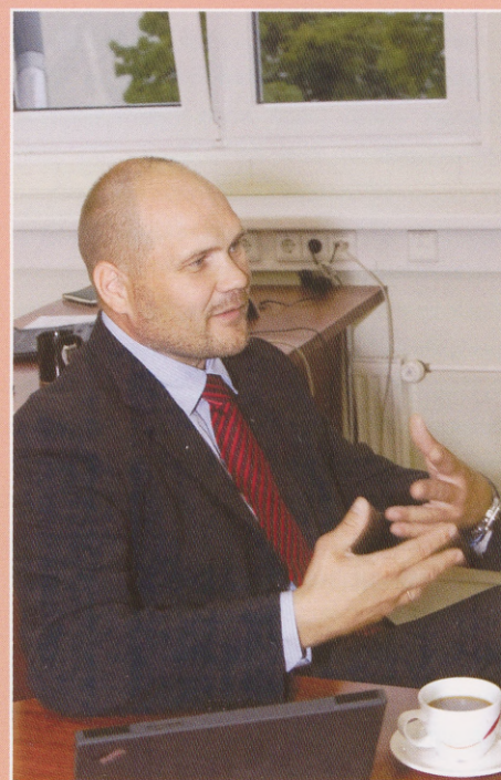
Aava arvates võiks inimesel olla tugev soov midagi olulist ära teha ja ta tahaks kuhugi jõuda, n-õ missioonitunne.

Oleme spetsiaalselt noortele välja töötanud erinevaid esitlusi, käinud koolides loenguid pidamas, võtnud osa Tallinna Ettevõtluspäevadest, „Teeviidast“ ja muudest üritustest. Loengute pidajateks püüame valida nooremaid kolleege – neil on hõlpsam publikuga kontakti saada. Käsitletavateks