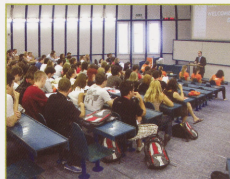
Ljubljana Summer School 2009.

Seltskond Norras oli kindlasti hulga rahvusvahelisem. Kokku oli meil kolm õppejõudu, kellest üks oli Norrast ning teised kaks olid Indiast ja Kanadast. Norra elu on aga mitmeid korda kallim kui Eestis. EBSi asukoht on kindlasti parem, kuna asub täpselt kesklinnas. EBSis õpetavad oma valdkonna parimad professionaalid. Õpin koos tudengitega, kes on tegijad juba praegu ja samuti tulevikus. Iga inimene, kes EBSis töötab, on pühendunud sellele, et sind tekkiva küsimuse puhul aidata, ning hoolitseb ka selle eest, et alati lahkusid rõõmsas tujuis.