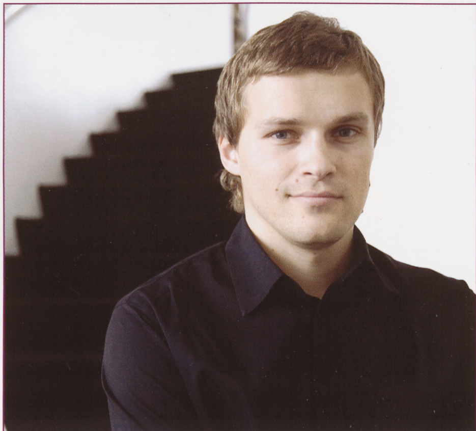
Investeerimisega sina peale.