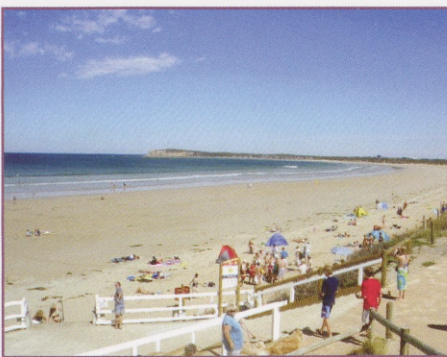
Vaikse ookeani paradiisirand Austraalias.

Austraalias on kindlasti väga palju vaatamisväärsusi. Milliseid neist