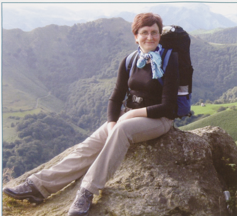
Moment of rest in the mountains of South France.

In one of the next albergues at Lorca we met a student from Paris who was walking