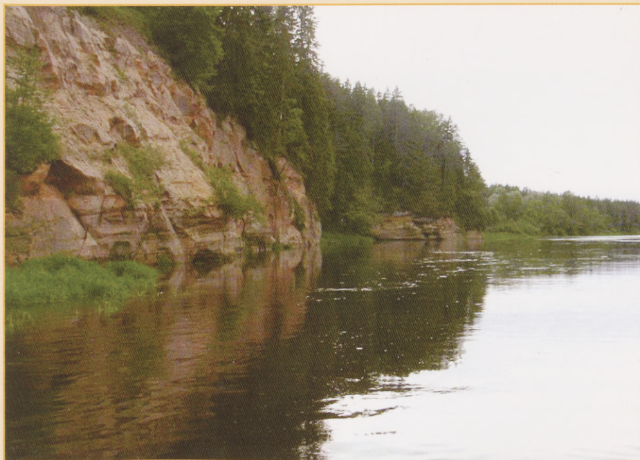
Vaikus enne tormi, juunis sadas palju vihma ja Koiva veetase oli pea meetri tavalisest kõrgem.

kuid läks õnneks. Nimelt oli just juuni see kuu, kui sadas palju vihma ja Koiva veetase oli pea meetri tavalisest kõrgem.