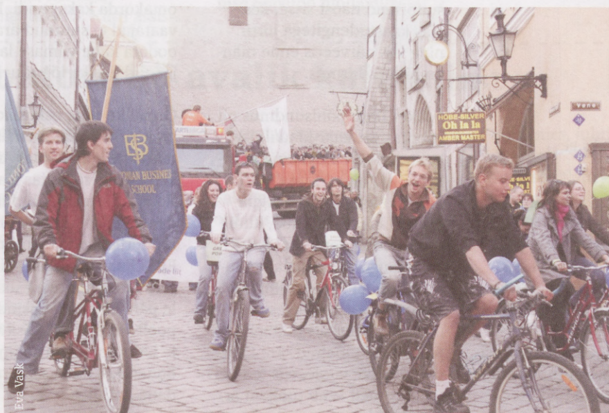
EBS Green Power

In Tallinn, traditionally, the third week of April belongs to students, as it is time for Student Days. The Opening Parade of Student Days has always been a great way of uniting all the students in Tallinn as one happy celebrating family. During the parade everybody can show their overflowing emotions after a dark period of serious studying. EBS Students are already