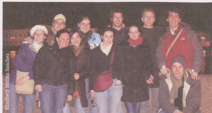
ERASMUS in St. Petersburg on the night excursion

very good. We visited the Winter Palace of Peter the Great, the Hermitage and we did roundtrips with the bus during the day and as well at the night. To see all the bridges rising at 01:00 was an impressive experience.