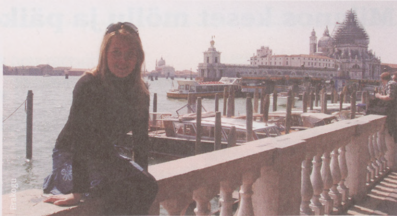
Kristi külaskäigul Veneetsiasse

Miljard: „See on paljuski siiski sinu enda teha. Valisime 4–6 ainet ja ei ütles, et see ajaliselt rohkem või vähem aega võtab kui EBSis. Bocco-