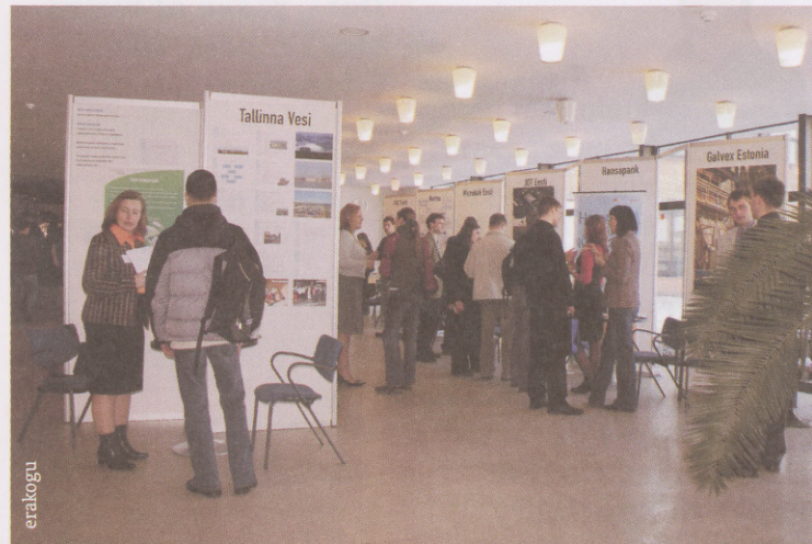
erakogu Võti tulevikku

Karjäärpäevad. Kahe päeva jooksul leiavad aset põnevad seminarid, firmade presentatsioonid ning palju muud huvitavaid ja kasulikke. Firmadel avaneb võimalus luua üliõpilastega otsekontakt, mis toob kasu nii neile endile kui ka tudengitele. Tänavu on projektis osa-